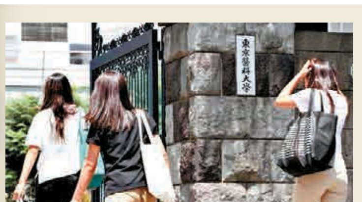
▲2018年東京醫大的女考生合格率僅為2.9%