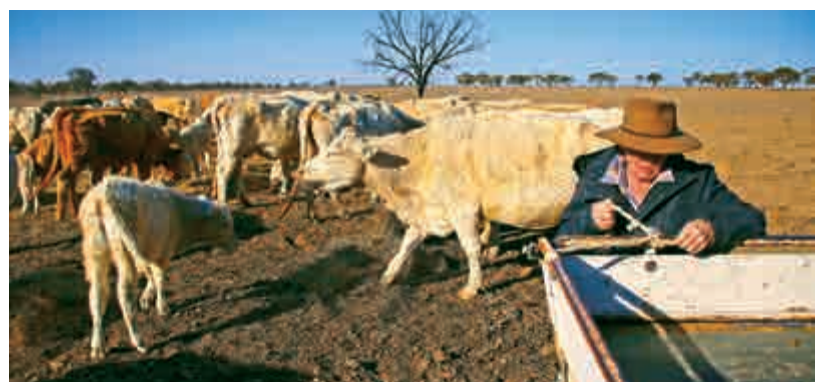
澳洲新南威爾士州旱情嚴重，牲畜牧草短缺

儘管日本政府表示女性就業情況良好，但東京醫科大學錄取事件，暴露出日本根深蒂固的性別歧視文化。在世界經濟論壇的性別不平等排名中，日本在全球144個國家及地區中的排名，由2016年的第111位跌至2017年的114位。