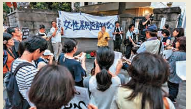
▲日前有醫界人士和學生到東京醫大抗議