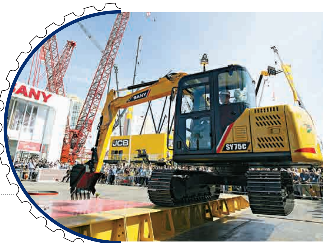
▲去年3月8日，在美國拉斯維加斯舉行的工程機械展上，中國三一重工的挖掘機進行特技表演 資料圖片