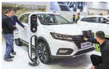
▲4月12日，國際節能與新能源汽車展會在南京開幕，純電車成焦點

商務部新聞發言人8日發表談話，稱美方決定自8月23日起對160億美元中國輸美產品加徵25%的關稅，又一次將國內法凌駕於國際法之上，是十分無理的做法。中方為維護自身正當權益和多邊貿易體制，不得不做出必要反制，決定對160億美元自美進口產品加徵25%的關稅，並與美方同步實施。