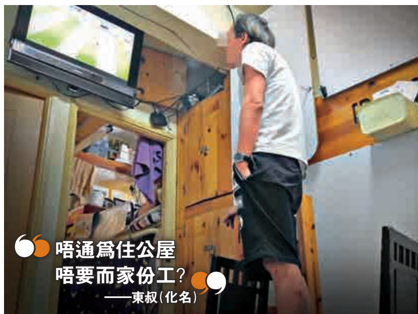
唔通為住公屋 唔要而家份工? ——東叔(化名)

記者所見，阿華賭性未除，經常透過手機登入馬會戶口，投注足球賽事，更問記者有否馬會投注帳戶，要求代為下注。記者答說沒有，他便立即落樓趕到投注站落注。他的名言是：「有本先有得贏！」