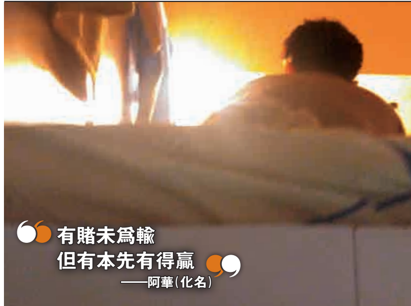
有賭未為輸 但有本先有得贏 ——阿華(化名)