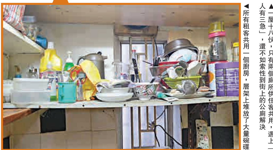
▲「一屋十八伙」，只有兩個廁所供住客共用，遇上「人有三急」，還不如索性到街上的公廁解決 ▲所有租客共用一個廚房，層架上堆放了大量碗碟

大公報記者其後表明身份致電陳小姐，查詢有關床位及「太空艙」出租情況，她稱出租床位沒太多人租，有些住客住了一個月便離去。被問及是否已申請床位寓所牌照，她隨即掛線。