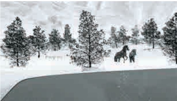
▲《廿四格》中常見到大自然與動物