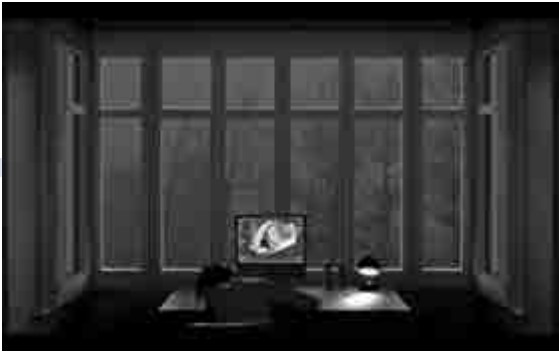
▲電影最後一格是有人在電腦前睡着了

影片聚焦動物及大自然，但太過局限在四五分鐘的框框中，所以每次我們看見某隻動物給吃掉，就是在那