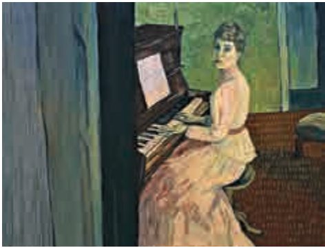
▲《情謎梵高》將梵高的畫作與他的人生融合