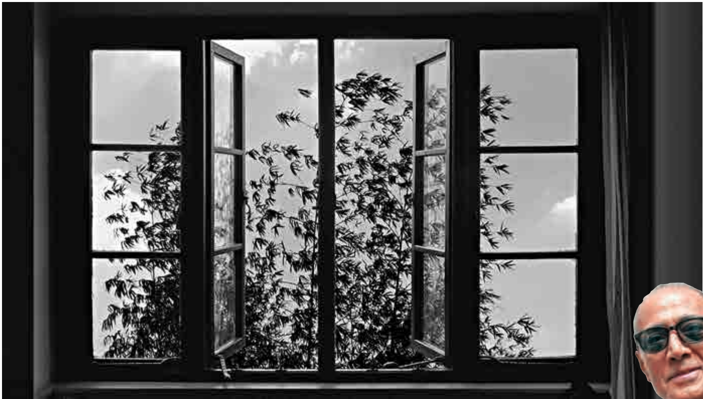
◀窗是電影裏經常出現的元素