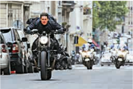
◀《職業特工隊：叛逆之謎》票房成績亮眼