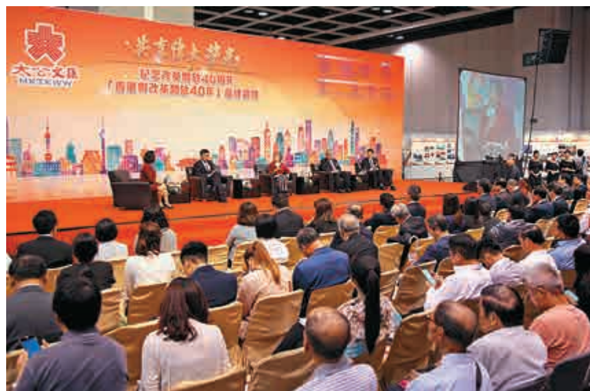
▲在論壇上有學者指出，香港未來要明白服務內地市場的重要性

【大公報訊】記者趙建強、陳玉蓮報導：在「香港與改革開放40年高峰論壇」上，有學者指出，國家改革開放四十年，香港擔負的角色將會逐步改變，香港未來要明白服務內地市場的重要性。有企業家認為，港人應該趁粵港澳大灣區的發展機遇，將落後的技術淘汰，推出更多新產品以應付競爭。