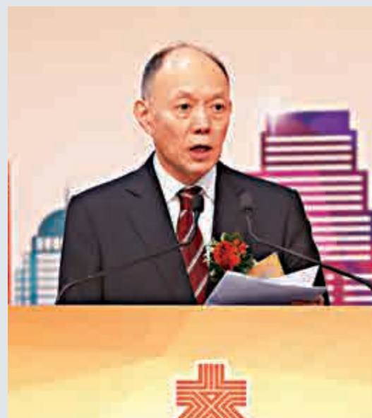
▲霍震寰表示，香港40年來抓住歷史機遇，成為國家對外開放的重要窗口