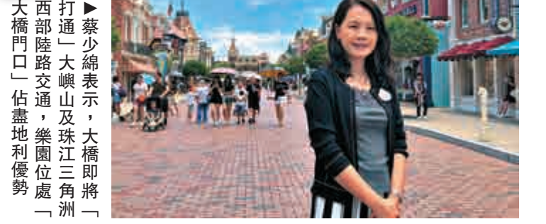
▶蔡少綿表示，大橋即將「打通」大嶼山及珠江三角洲西部陸路交通，樂園位處「大橋門口」佔盡地利優勢