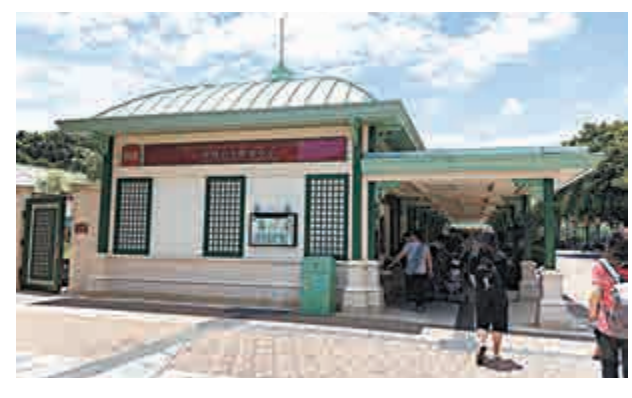
▶香港迪士尼樂園「點對點」跨境巴士服務，未來將增至27個 資料圖片

網上傳出，港珠澳大橋口岸穿梭巴士「港澳線」，往返香港、珠海和澳門，單程票價為80元。港澳線24小時通宵行駛，繁忙時段每5分鐘一班，非繁忙時段10至15分鐘一班，通宵時段則15至30分鐘一班。澳門口岸設有14個售票櫃位及20部自助票務機。