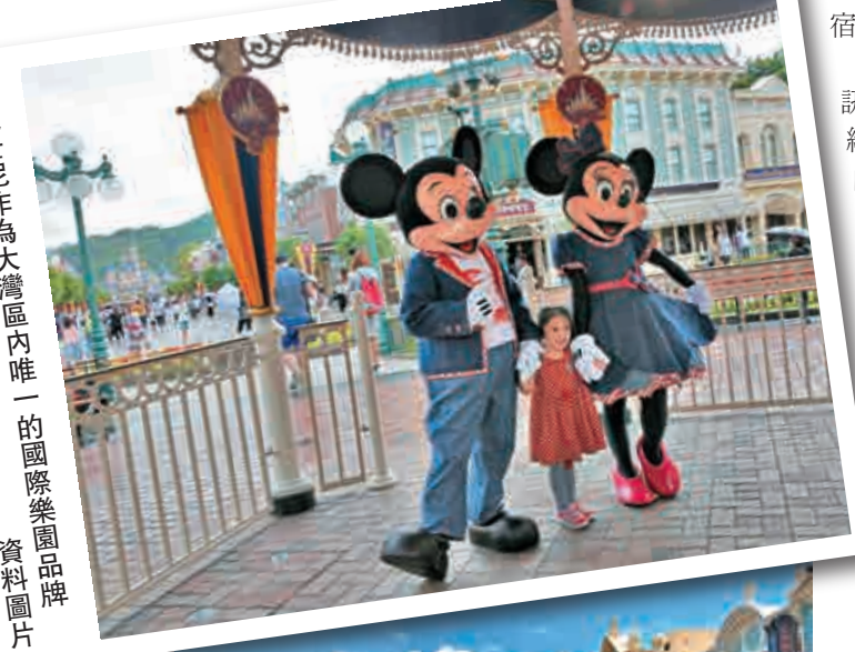
▶迪士尼作為大灣區內唯一的國際樂園品牌 資料圖片

樂園並正計劃提升軟件配套，包括優化「點對點」跨境巴士服務，由現時從香港迪士尼直接往返內地17個城市，未來增至27個，包括珠西地區等。而福州、廈門、武漢等距離本港較遠的城市，隨著廣深港高鐵香港段通車，當地居民的「五小時生活圈」將擴闊至香港，有利提升他們的訪港意慾。樂園除了在西九龍車站設立服務中心，協助旅客寄存行李外，亦會觀察內地旅客來港模式變化，以作對應。