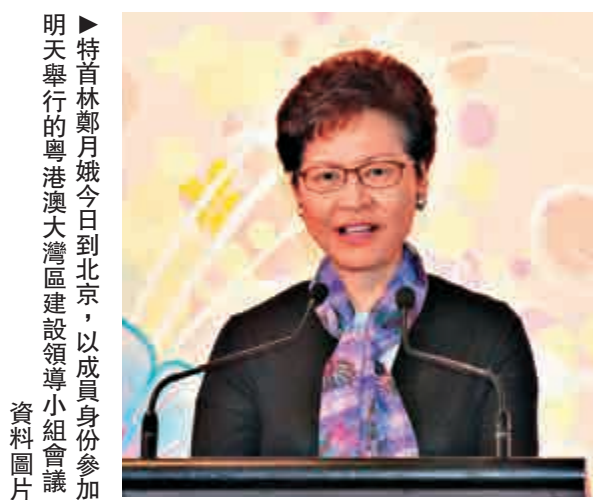
▶特首林鄭月娥今日到北京，以成員身份參加明天舉行的粵港澳大灣區建設領導小組會議 資料圖片

林鄭月娥上任後多次訪京，對上一次是上月25日至28日，今次是她一個月內第二次訪京。而林鄭月娥上任以來，對大灣區的規劃和發展不遺餘力，不斷到訪大灣區的城市，特別是了解當地創科上的發展合作，如在上月20日到深圳訪問一天，參觀智能城市、醫療和機器人。