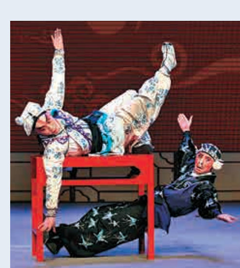
▲京劇《三岔口》不唱不念，動作就是語言 資料圖片

箍棒似的白蠟杆，腿不到高，腰不到底，手未上架，躍不過桌，一言不發，掄起白蠟杆就是一棍，一棍就是一片青，一道棧，三天不敢碰，一碰痛三天。富連班教出那麼多大師，「招兒」就一條，嚴師出高徒。吊嗓吊得如何？徒弟們一字在宣武門外護城河邊排開，對着河對面一片蘆葦蕩開「吊」，要「吊」到把葦蕩中的水鳥驚得撲簌簌地飛起，那要靠真功夫。老話兒：心慈不得將軍作。著名武生演員蓋叫天學戲時更怕人，師傅是手執一把明亮亮、光閃閃的鋼刀立在旁邊，一臉怒氣，殺氣騰騰，練不到位輕則掄刀就拍，重則用刀背砍。也練就蓋叫天的天下「獨活」，從十八把椅子操起的「獅子樓」上一躍而下，驚得全場先是爆冷，嚇得滿場寂靜，繼而爆火，引得劇場一片歡騰。蓋叫天人稱「活武松」，他能演出各個時期不同風格的武松，生病柴家莊、打虎景陽岡、報仇獅子樓、醉打十字坡、大鬧快活林、血濺鴛鴦樓、夜走蜈蚣嶺，有「英名蓋世三岔口，傑出驚天十字坡」。蓋叫天曾經把腿摔折了，醫生接時未能接好，錯骨扭環，天下可惜一代武生天王將告別舞台，蓋叫天得知後，彷彿看見師傅那把冷風嗖嗖的鋼刀，二話沒說，把腿架在桌子上，一咬牙，一使勁，自己壓斷那條剛剛接上的傷腿，讓醫生重接。面對蓋叫天，何人敢空談為藝術獻身？