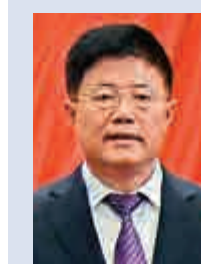
李晉修 吉林省政協副主席，2015年12月至2017年4月任分管吉林省食品藥品監管工作的副省長 責令辭職