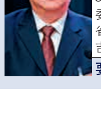
姜治瑩 吉林省委常委、延邊朝鮮族自治州委書記，2012年3月至2016年5月任長春市委副書記、市長 要求作出深刻檢查