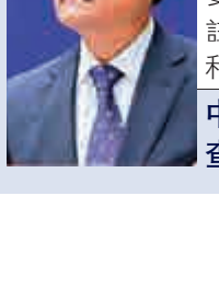
吳滇 原食品藥品監管總局副局長、原衛生計生委副主任，分管藥化註冊管理、藥化監管和審核檢驗等工作 中紀委進行立案審查調查