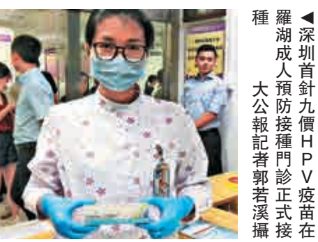
▲深圳首針九價HPV疫苗在羅湖成人預防接種門診正式接種。

【大公報訊】記者郭若溪深圳報道：備受女性關注的九價HPV疫苗終於在深圳上市了，16日，深圳首針九價HPV疫苗在羅湖成人預防接種門診正式接種，年齡限定爲16-26歲女性。據了解，深圳九價HPV疫苗接種三針，費用總計3969元人民幣（下同，約爲4518港元），遠較香港已瀕至萬元的價格便宜。但由於疫苗數量有限，門診每天僅提供10個接種名額，而預約注射量已超三萬人，嚴重供不應求。