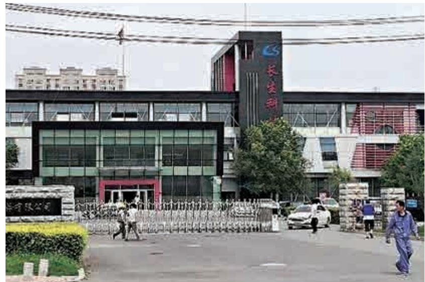
16日，國務院常務會議確定，由相關方面依職權沒收長春長生公司所有違法所得並處最高罰款。資料圖片