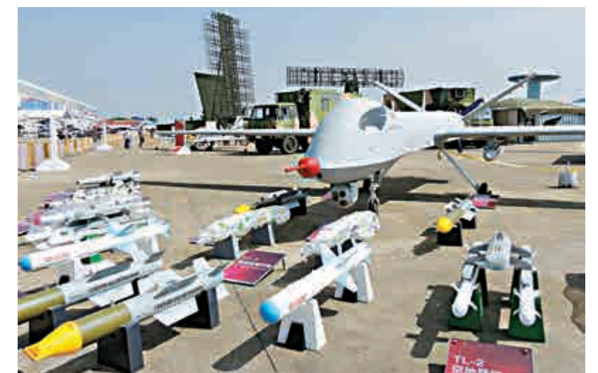
▲中國空軍、陸軍將同台，展示代表當今先進水平的現役武器裝備。圖為上屆航展展出的先進無人機 資料圖片

爲全面展示改革開放四十年來、特別是十八大以來中國在航空航天及國防科技領域所取得的突破性成就，中國五個門類10大軍工企業大規模參展。同時，在國家「一帶一路」、「軍民融合」全面實施的大背景下，本屆航展還按照民航客機、航空發動機及MRO、公務機和通航、無人機、軍民融合等領域設立專題展區。主辦方更透露，世界知名航空航天企業也基本悉數亮相，特別是「世界TOP100」航空航天企業及「一帶一路」沿線國家參展比例有較大幅度提高。「一批代表世界先進水平的「高、精、尖」展品有望集體亮相，特別是中國參