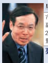
畢井泉 市場監管總局黨組書記、副局長，2015年2月至2018年3月任原食品藥品監管總局局長 要求引咎辭職