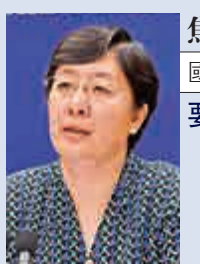
焦紅 國家藥監局局長 要求作出深刻檢查