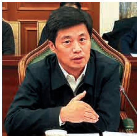
金育輝 吉林省副省長，2017年4月起分管吉林省食品藥品監管工作 予以免職

會議強調，要完善法律法規和制度規則，明晰和落實監管責任，加強生產過程現場檢查，督促企業履行主體責任義務，建立質量安全追溯體系，落實產品風險報告制度。對風險高、專業性強的疫苗藥品，要明確監管事權，在地方屬地管理的基礎上，要派出機構進行檢查。要加強監管隊伍能力建設，盡快建立健全疫苗藥品的職業化、專業化檢查隊伍。要提高違法成本，對那些利慾薰心、無視規則的不法企業，對那些敢於挑戰道德和良知底線的人，要嚴厲打擊，從嚴重判，決不姑息。對涉及疫苗藥品等危害公共安全的違法犯罪人員，要依法嚴厲處罰，實行巨額處罰、終身禁業。要加強幹部隊伍建設，激勵擔