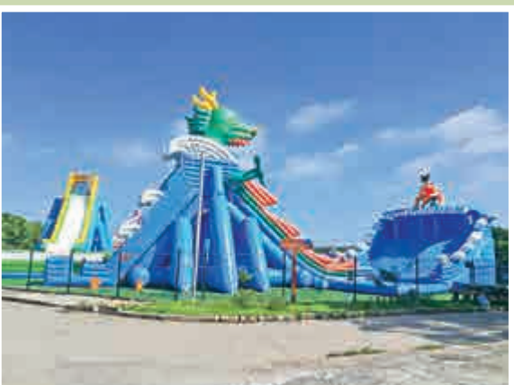
▲古村外的動漫樂園