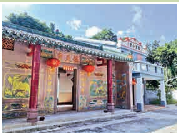
▲協天宮和鶴藪小學由華僑和港人捐資重建