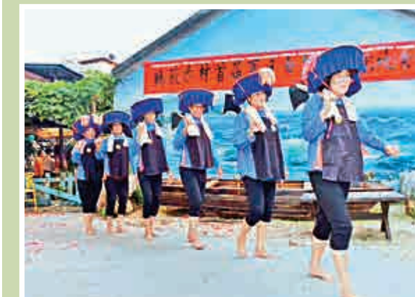
▲古村是嶺南文化和漁村文化的完美結合