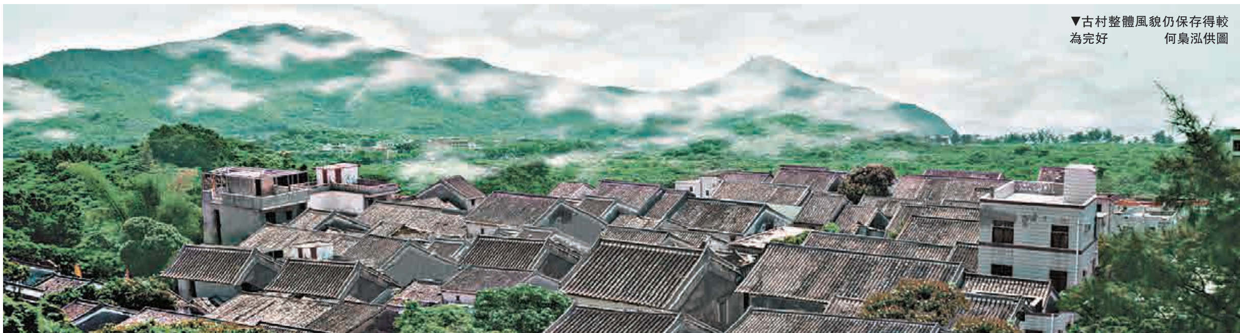
▼古村整體風貌仍保存得較為完好