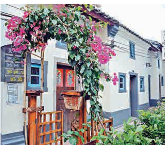
▲古村客棧由典型的嶺南漁村庭院改建而成

上山下海，看山潛水，騎馬射箭，快艇踏浪，燒烤喝酒……活在鋼筋水泥中的都市人對田園風光都有一種嚮往，但是在深圳，鶴藪古村把嚮往演變為現實。這座千年古漁村，是嶺南文化和漁村文化的完美結合，是都市市民追溯歷史、感受自然的絕佳選擇，也是體會「面朝大海，春暖花開」的好去處。