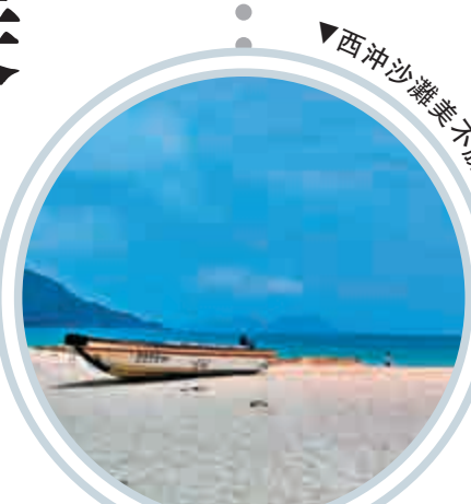
▼西沖沙灘美不勝收