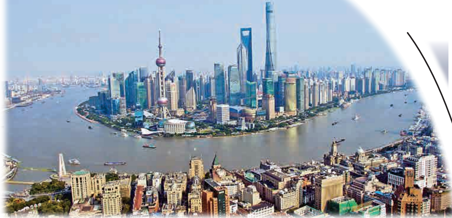
▲今日的浦東陸家嘴金融貿易區