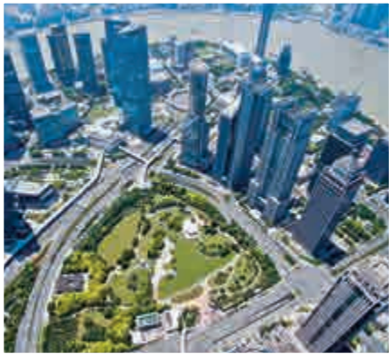
▲今日陸家嘴中心綠地當年曾被外地媒體調侃「上海人氣魄大，七億修個大花園」