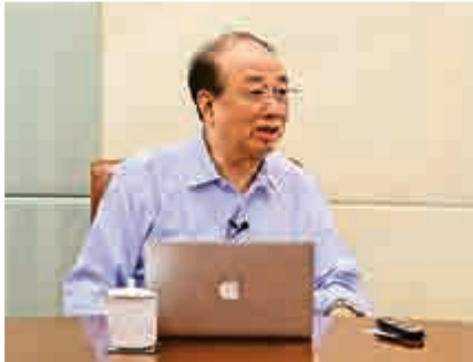
◀「浦東趙」趙啟正接受大公報專訪