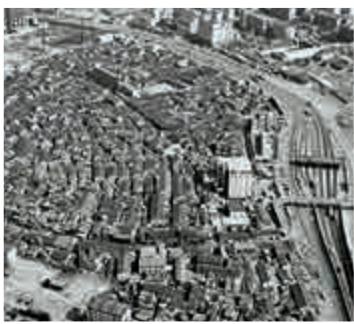
▲陸家嘴中心綠地原址 浦東檔案館