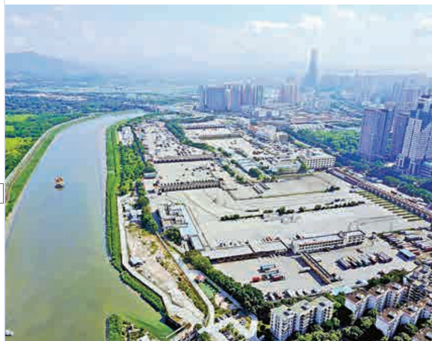
▲近日，廣東首次提出「廣深科技創新走廊+香港、澳門」概念，探索粵港澳科研合作新模式。圖為深圳河套區。資料圖片