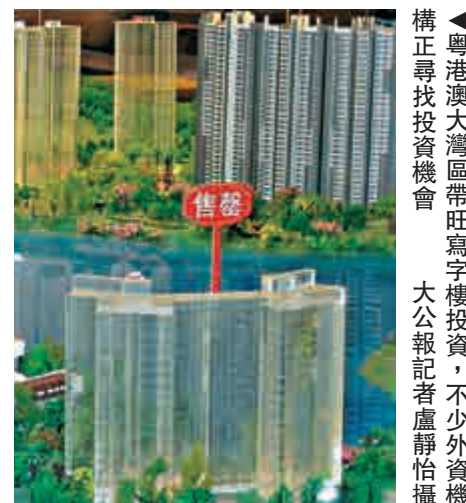
▲ 粵港澳大灣區帶旺寫字樓投資，不少外資機構正積極進入內地市場。比如香港和新加坡企業不僅將內地作為重要的開拓市場。她表示，因為香港等外資機構擁有雄厚的資金實力，不受融資收窄的影響，正進一步加速尋找適合的投資機會。