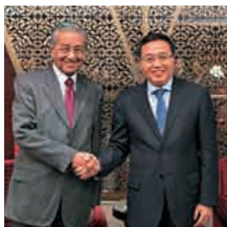
▲ 馬來西亞總理馬哈蒂爾與中國銀行董事長陳四清（右）近日在京會面

馬哈蒂爾回顧了1997和1998年亞洲金融危機，當時馬來西亞政府非常關注其他國家管理本國貨幣的經驗，希望控制令吉的匯率跌勢。中國管控人民幣、限制國際