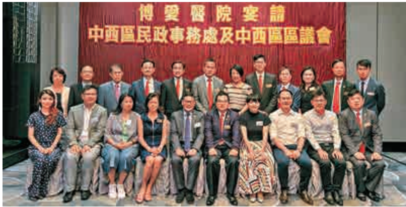
▲博愛醫院戊戌年董事局成員拜訪中西區民政事務處及中西區區議會，交流意見