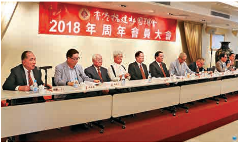
▲福建社團聯會日前舉行周年會員大會，多位主席團成員等領袖出席