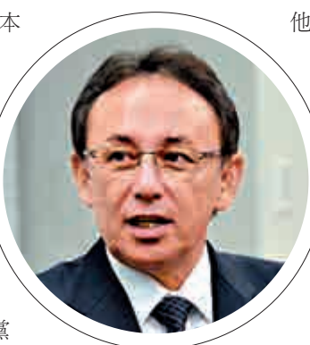
▲將競選沖繩知事的駐日美軍之子玉城網絡圖片

【大公報訊】據《日本時報》、《朝日新聞》報道：致力於日本美軍基地撤出沖繩縣的當地知事翁長雄志，本月初因胰腺癌猝逝。繼承他遺志的駐日美軍之子玉城Denny，20日暗示將會參加於下月30日舉行的縣知事選舉。 58歲的玉城現為自由黨秘書長，他出生於沖繩縣的宇流麻市，過去曾任廣播節目DJ與沖繩縣議員，2009年成為國會眾議院議員，如今已經是第四屆任期。他支持翁長，反對美軍駐沖繩基地普天間機場，由宜野灣市搬遷至名護市。支持翁長的團體近來要求他參選，玉城亦有意接受。他表示：「我得準備好競選宣言，包括用什麼來支撐我的政策。」