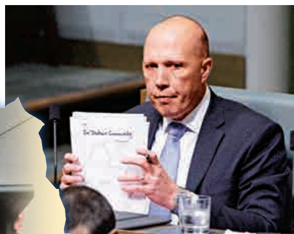
▲向總理之位發起挑戰的前內政部長達頓

除了逼宮失敗的達頓主動辭職外，包括衛生部長與貿易部長在內的其他九名部長也都遞交了辭呈，但特恩布爾只接受了達頓和國際發展部長費拉萬蒂一韋爾斯的申請。不過，特恩布爾內閣的核心成員、總理助理部長麥格拉斯堅持自己也成功辭職。 此外，據澳洲傳媒報道，達頓的支持者從22日開始游說，希望得到自由黨85位議員中過半人聯名簽署召開黨內會議，22日晚一度有傳言達頓拉攏到9人。由於澳洲議會將從24日起進入為期兩周的休會期，若達頓未在23日成功得到43人支持，他的逼宮大計只能推遲至兩週後議會重新開啓。