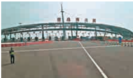
▲等待開通的港珠澳大橋

稱，若過橋定價收費為200元人民幣，則乘客票價定為日間170港元、夜間190港元；若收費定為450元人民幣，則乘客票價相應分別調至200港元和220港元。這也意味着，最終方案在節省巴士公司成本同時，亦相應為乘客單程節省約30港元車費。