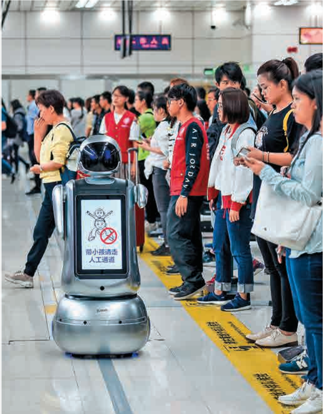
▲廣東大數據智能化指數全國居首。圖為在深圳灣口岸出境大廳，智能機器人在自助查驗通道前對旅客進行提示