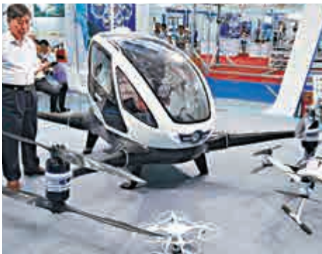
▲在深圳舉行的中小企業技術交流暨展覽會上，無人機展台吸引觀者

值得注意的是，報告指出中國傳統意義上的經濟發達地區，在大數據發展潛力和所佔據的比較優勢相較經濟稍欠發達地區並不凸顯，貴州、重慶、安徽等中西部省市發展環境明顯優化。