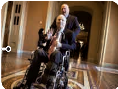
▲麥凱恩2017年在被診斷患上腦癌之後依舊沒有缺席參議院工作

樣經受了這麼多考驗、展現出這麼多勇氣……儘管有時意見不一，我們同樣有着更崇高的理念——歷代美國人和移民都為之奮鬥、前進及犧牲的理念。」