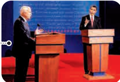
▲2008年，麥凱恩(左)與奧巴馬進行總統辯論

被診斷出膠質母細胞瘤(惡性腦癌)，積極對抗病魔的同時依舊在政壇上活躍，是批評總統特朗普的主力