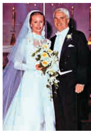
▲麥凱恩與妻子辛迪1979年墜入愛河，並於次年結婚

報道引述他們一位朋友指，麥凱恩在越戰中受傷，手無法抬高，辛迪經常幫他梳理頭髮。而辛迪也曾因背部受傷沉迷止痛藥，麥凱恩則偷偷藏起藥物，幫助她治療成癮症。