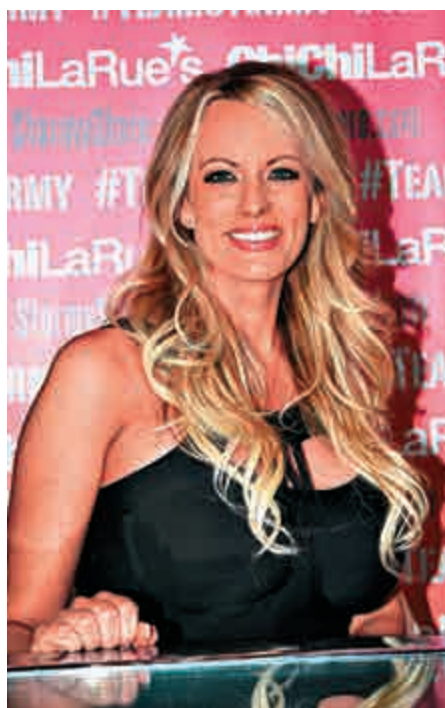
▲艷星丹尼爾斯日前身陷「艷星門」，矢言將會向國會指證特朗普

除此之外，她還聲稱今年早些時候在拉斯維加斯的停車場內有人警告她不要將上述事情洩露出去，否則有生命之虞，甚至威脅要讓她女兒知道這些事。為此她還僱了兩個貼身保鏢進行全天候保護。