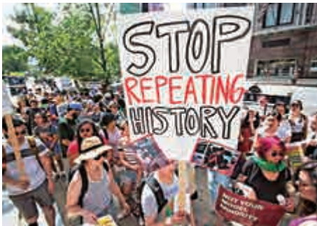
◀美國亞裔團體6月在芝加哥抗議總統特朗普分離家庭 的邊境政策

【大公報訊】據美國《紐約時報》報道：《我的超豪男友》可能展示了另一種「刻板印象」，即美國亞裔都過着光鮮亮麗的生活。然而真實的情況卻是，亞裔美國人已經取代非裔，成為貧富懸殊最大的族群。 電影男女主角楊力和朱麗秋是紐約大學年輕有為的教授，令人艷羨。楊力更是出生於新加坡一個極度富裕的家庭，而朱麗秋則是明星經濟學家，雖然之前曾與來自中國的母親一起艱難度日。 但現實是殘酷的，熒幕後還有眾多的生活艱難的底層亞裔。首先，亞裔收入的兩極分化極為嚴重，富裕的亞裔成為美國收入最高的群體，但貧困亞裔的收入基本上沒有增長。美國人口普查局數據表明，亞裔美國人已成為貧富差距最大的族群。從1970年到2016年，亞裔美國人的收入不平等水平幾乎翻了一番。截至2016年，收入最高10%的亞裔，比最低10%的亞裔每年多收入12萬美元。 此外，美國貧困亞裔的絕對人數也在增多，以紐約為例，這裏的亞裔是最貧窮的移民群體，在大約15年的時間裏，貧困亞裔增加了44%，從2000年的17萬人增至2016年的逾24.5萬人。 亞裔美國人如今已佔全國人口的6%，並且其組成非常多元，來自不同的國家地區的移民收入水平也有很大差距，這主要是教育水平、職業技能和英語熟練程度的不同造成的。來自印度和華人地區的移民比東南亞移民收入更高，因為前者的平均受教育水平更高。而來自越南、柬埔寨和老撾等東南亞國家的群體則有許多難民，收入遠遠低於其他亞裔，但他們的人數已經超過了東亞裔移民。