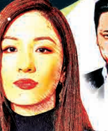
美籍華人 女主角:吳恬敏