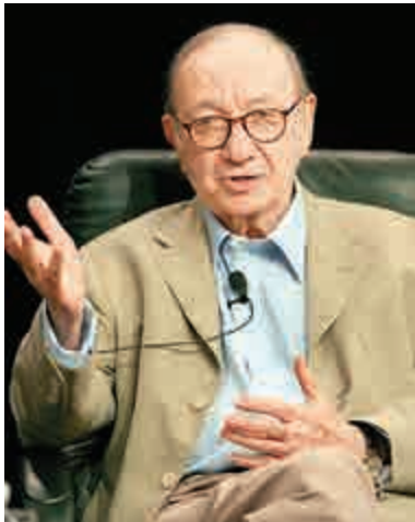
享年91歲 美劇作家尼爾西蒙於26日在紐約病逝

喬治小王子是英國王室第三順位繼承人，過去一年已在托馬斯巴特希學校完成學前教育，這所私立學校每年學費高達1.76萬英鎊（約17.8萬港元），課程種類多元化。