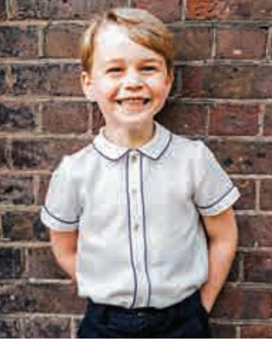
▲喬治王子入學後將面臨繁重的課業