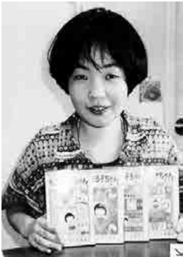
►《小丸子》原作者櫻桃子15日因乳癌辭世，享年53歲

【大公報訊】據中央社、中新網、共同社報道：陪伴許多人成長，數十年來紅遍亞洲的日本漫畫《櫻桃小丸子》的作者櫻桃子（本名三浦美紀）於15日因患乳癌病逝，享年53歲。櫻製作公司於27日在官網公布了她的訃告。由於櫻桃子一直未公布病情，噩耗令日本國內外都感到震驚。粉絲表示，「謝謝你帶來美好的童年回憶，一路走好」。