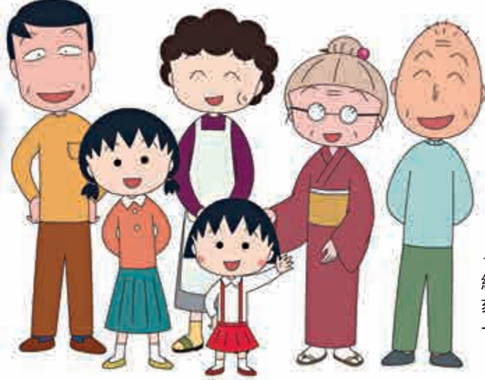
◀漫畫以作者經歷為藍本，刻畫了溫馨的一家人