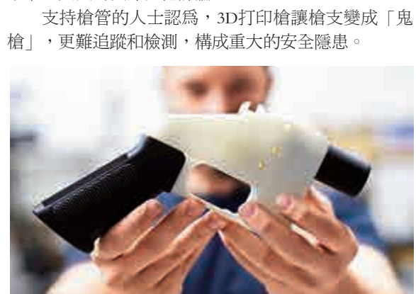
▲3D打印槍死灰復燃，創始者透過手指售圖紙 資料圖片

支持槍管的人士認為，3D打印槍讓槍變成「鬼槍」，更難追蹤和檢測，構成重大的安全隱患。