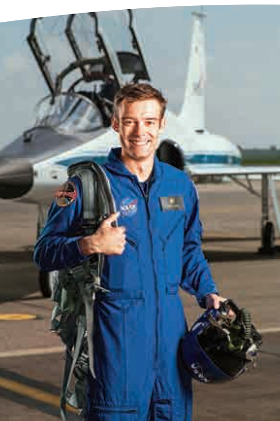
▲準太空人庫林因個人原因退訓