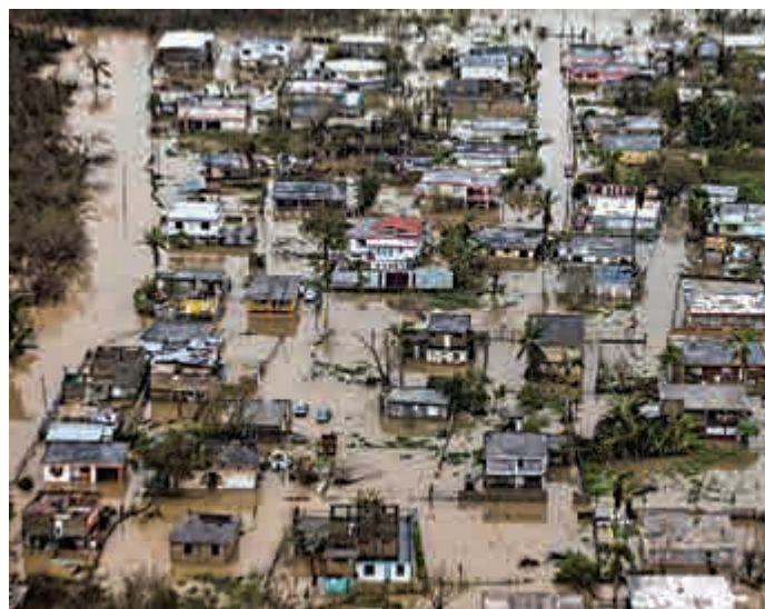
▲颶風「瑪麗亞」去年9月襲擊波多黎各，是「史無前例」的災難

【大公報訊】據美國有線電視新聞網、《紐約時報》報道：美國位於加勒比海的屬地波多黎各在遭遇颶風「瑪麗亞」侵襲接近一周年之際，當地政府28日公布與颶風相關的死亡人數，暴增至2975人，比官方數據的64人增加約45倍。