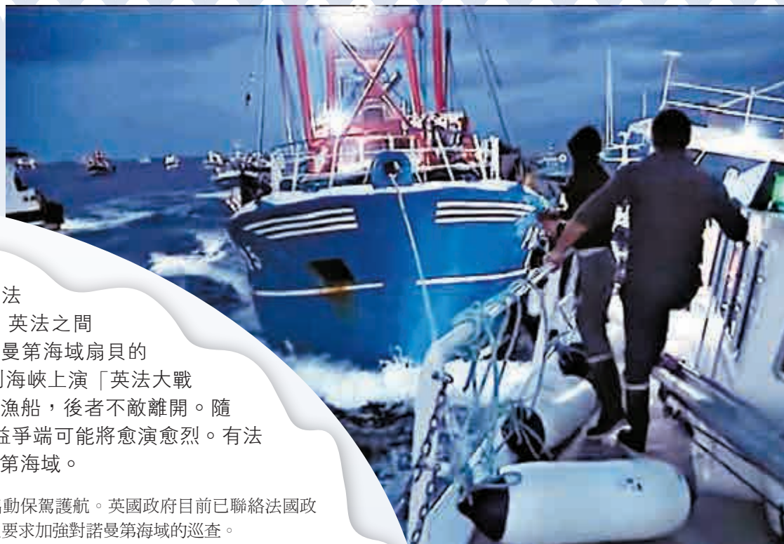
▲28日凌晨法國漁船在諾曼第海域對英國漁船發起攻擊

當前英國脫歐談判正焦灼進行，法國漁民則慶幸英國漁民好景不常，因為他們相信，明年3月英國正式脫歐之後，將成為第三方國家，不再享有共同漁業的進出特權，屆時英國將在諾曼第海域遭到徹底封殺。如這一情況發生，英國將面臨不小損失，因為扇貝捕撈為英國帶來大約每年一億兩千萬英鎊(約12.1億港元)的收入，並提供超過一千兩百個工作機會。