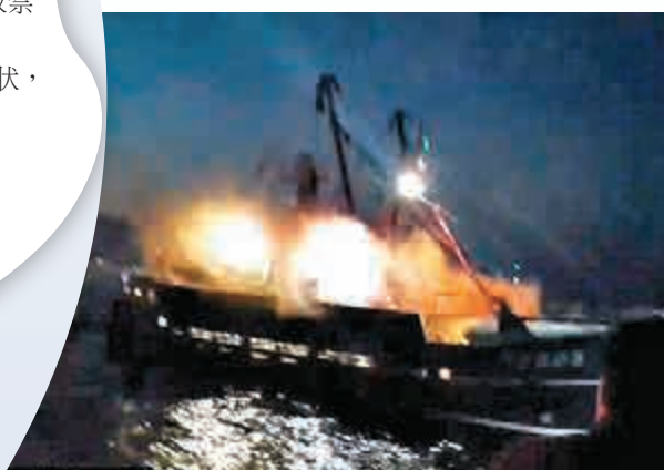
▲有法國漁民向英國漁船投擲照明彈 網絡圖片