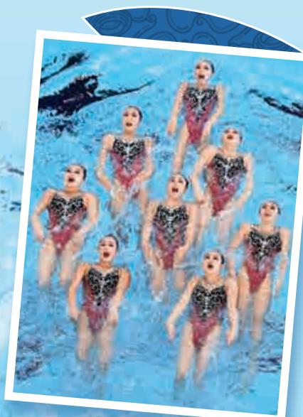
▲中國花游姑娘在水上綻放