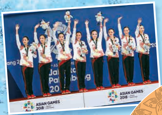
▲中國花游隊成員向觀眾致意