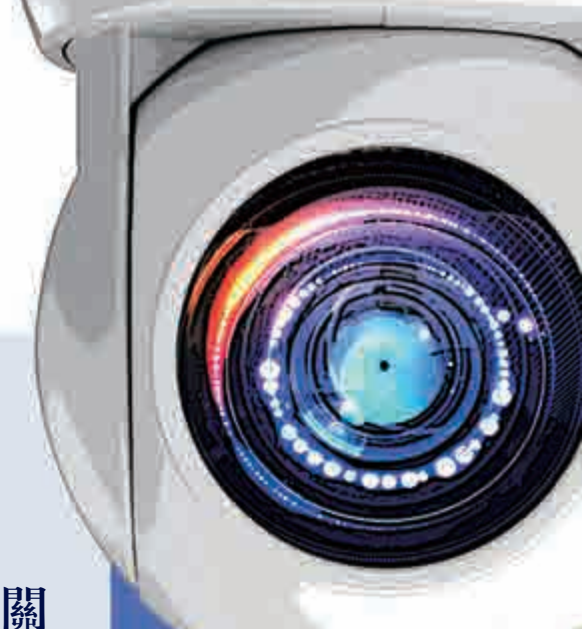
大公報直擊 口岸走水貨