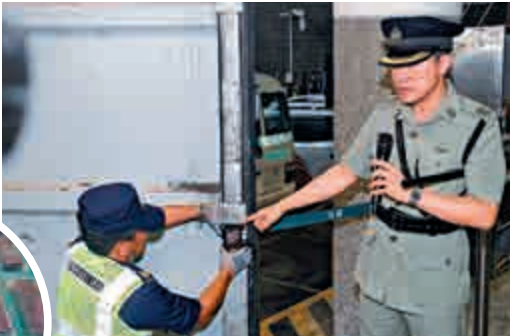
▲海關搗破一個跨國販毒集團，檢獲總值約3000萬元懷疑可卡因毒品