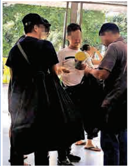
▲水貨客打開背囊拿出奶粉等物品