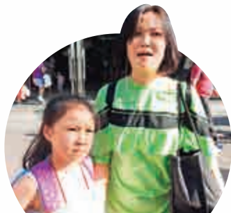
▲施女士期望深圳海關繼續打擊水貨客