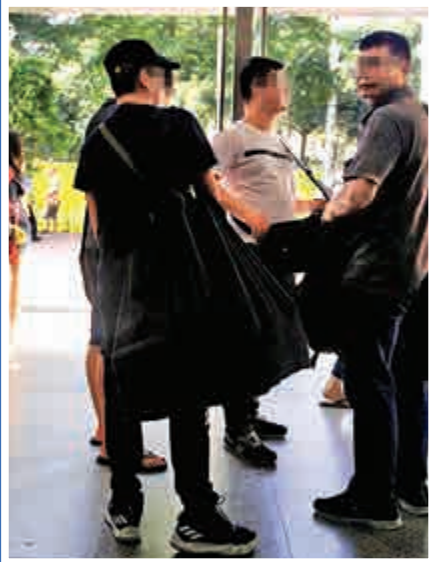
▲水貨客慌張查看四周