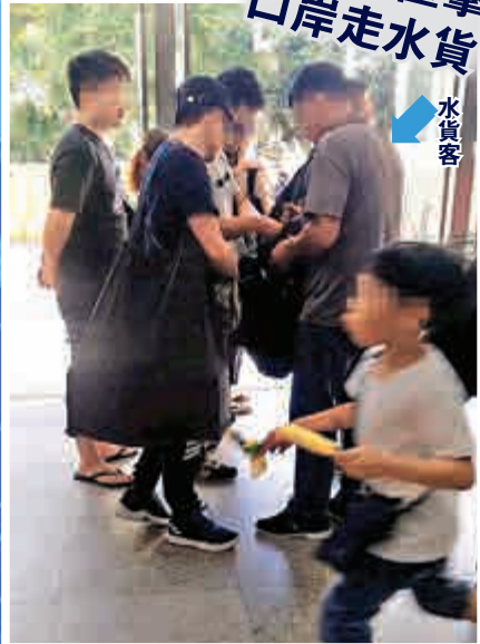
▲在福田口岸，一名水貨客急步走向收貨佬旁