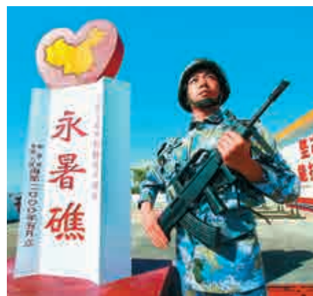
▲中國解放軍在永暑礁站崗