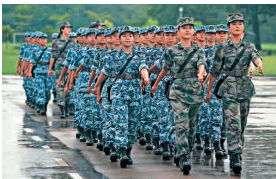
▲國防部新聞發言人吳謙表示，正在研究論證香港居民是否可以參軍入伍的問題。圖為香港大學生在解放軍駐港部隊軍營體驗軍旅生活 資料圖片

此外，近日日本政府公布的2018年《防衛白皮書》稱中國不透明的軍事擴張以及海洋活動，是包括日本在內的地區及國際社會的安全隱患。對此吳謙表示，日方2018年度《防衛白皮書》涉華內容不改陳詞濫調，充斥着對中國軍隊的抹黑污蔑，充斥着對歷史和現實的錯誤理解。我們堅決反對，將向日方提出嚴正交涉。中國在本國領海的正當合法活動無可非議，也將繼續常態化地進行下去。吳謙進一步說，日方對中國軍隊為世界和平所做的貢獻視而不見，渲染中國軍事威脅，我們堅決反對。