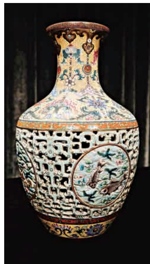
▲清乾隆洋彩「吉慶有餘」玲瓏尊，為御窯督陶官唐英所製

蘇富比香港秋拍資訊可瀏覽網址www.sothebys.com/hk，或關注官方微信帳號「蘇富比亞洲」及微博「蘇富比拍賣行」。