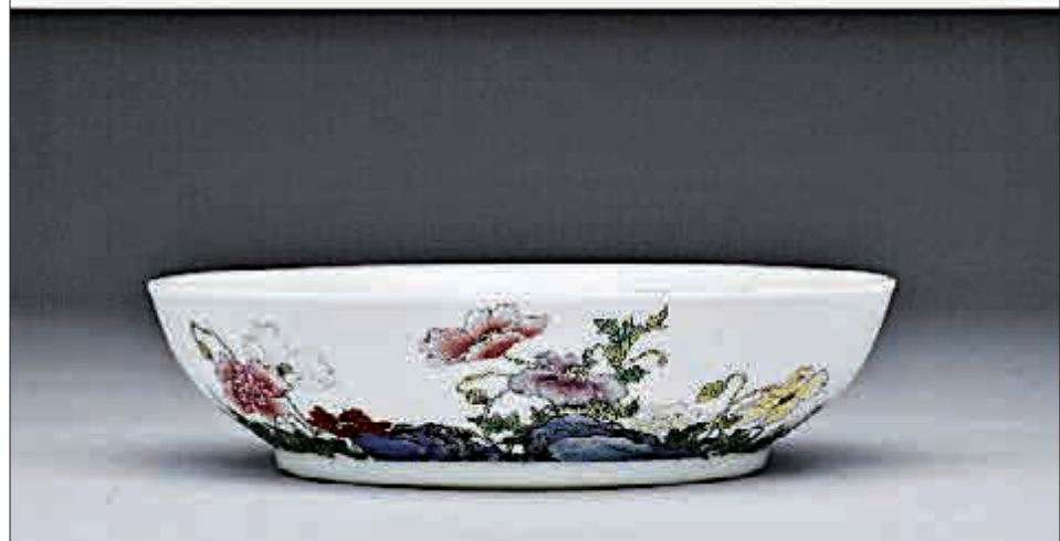
▲上圖為蘇富比拍品乾隆琺瑯彩虞美人盃（兩面），下圖為台北故宮藏雍正琺瑯彩虞美人碟