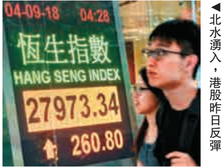
▲北水湧入，港股昨日反彈

活，碧桂園服務（06098）股價升6.1%，報14.14元；中奧到家（01538）升5.7%，報0.92元。計劃分拆物管業務的中國奧園（03383）股價有4.5%進帳。日前被藍紗的光伏股遇到獲利盤擠壓，陽光能源（00757）股價跌11.8%，報0.112元。卡姆丹克太陽能（00712）股價跌13.3%，報0.091元。