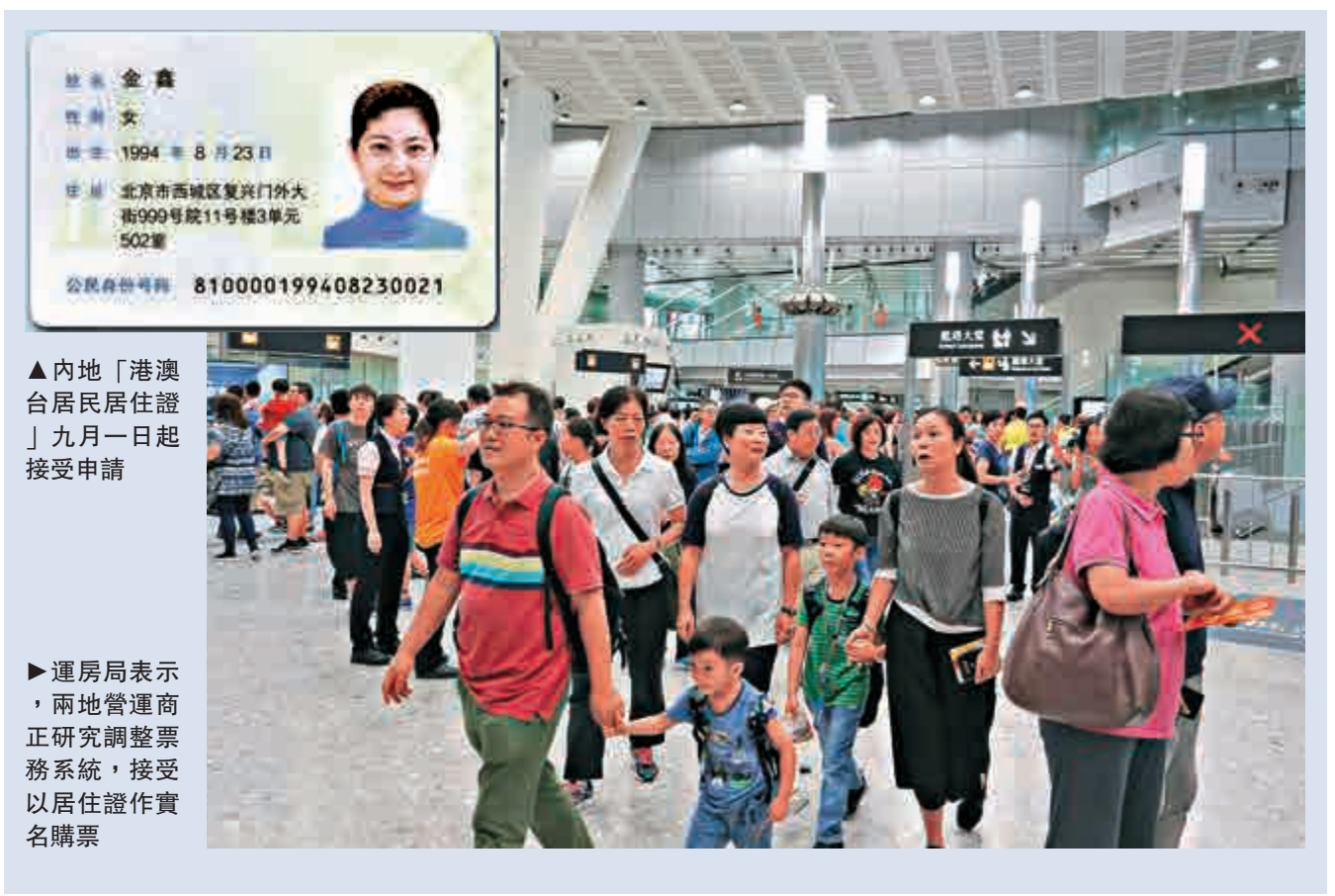
▲內地「港澳台居民居住證」九月一日起接受申請

此外，運房局Fb專頁「運房點線面」連日推出《廣深港高速鐵路「一、兩個問題」》短片，由兩名前主播詳解高鐵站香港和內地口岸區各項細節及注意事項（詳見表）。