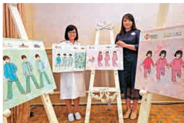
▲迪士尼捐出410萬元支持「童康服」項目，設計三款住院服

▶醫管局主席梁智仁（左二）、香港迪士尼樂園度假區行政總裁劉永基（右一）與嘉賓出席「童康服」合作項目發布會