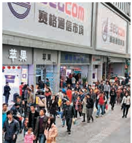
深圳華強北是亞洲最大的電子信息產品展示交易市場。圖為華強北步行街。

今年初，「一國兩制研究中心」發表研究報告，建議港深簽署合作協議活化中英街，將附近區域發展成邊境購物及文化區，簡化深圳一側內地居民出入中英街的手續，延長通關時間至少至晚上10時，消費限額由目前5000元至少提升至8000元。活化後的中英街每日人流或可由一千多人增至兩、三萬人。