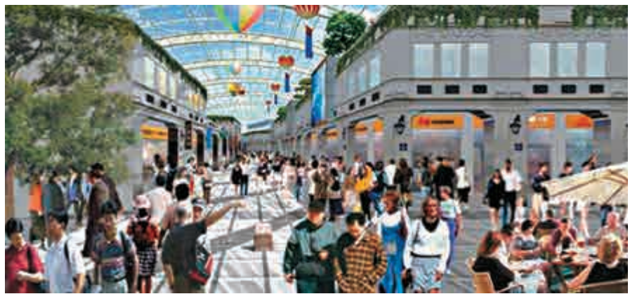
活化中英街構想圖。