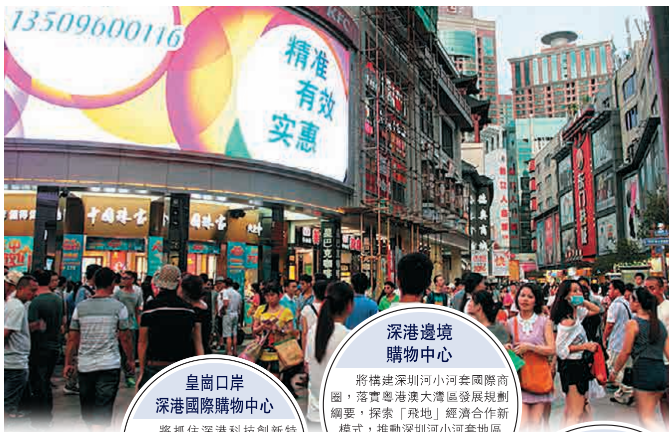
東門步行街是深圳市的著名步行街，它是深圳形成時間最早、最成熟和最具規模的商業旺區。

消費電子方面，充分發揮華強北「中國電子第一街」的品牌效應，加快片區工業廠房更新規劃，整合20萬平方米創新產業空間。濱海風情特色商街方面，包括連通太子灣郵輪港區和海上世界商業街，大力推進小梅沙片區升級改造和馬棚山區域、大鵬半島舊村落保護性旅遊開發利用。文旅創意商街方面，規劃建設從中華民俗文化村到世界之窗約2.6公里長的步行街。