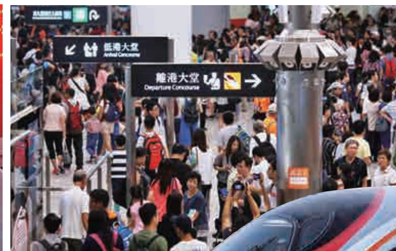
▲ 高鐵路西九龍站月初舉行開放日場面喧嘩 網絡圖片

福州 「票價不貴時間也快」 10日上午8時，郭小姐在福州車站售票專窗購買9張10月1日G3001次福州到西九龍站火車票，同時購買10月5日返程票9張。郭小姐表示，早已考慮赴港旅遊，且因西九龍站票價不貴，時間也快，索性調整了原來搭乘飛機的計劃。 (記者 蔣煒基)