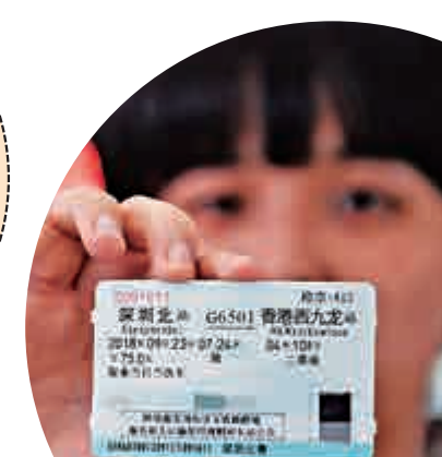
▶ 10日，一名市民在深圳北站展示9月23日深圳北至香港西九龍站的高鐵路車票

上海 「會願意嘗試，嘗鮮嘛」 在滬港人Samson說，若香港至上海的列車票價高於2000港元就不會考慮高鐵路，但表示「會願意嘗試，嘗鮮嘛！但是應該不會經常乘坐。」Samson解釋，目前高鐵路時刻安排對商務人士來說會耽誤近一天工作，估計商務人士未必會選乘高鐵路。 (記者 倪夢環、夏薇)