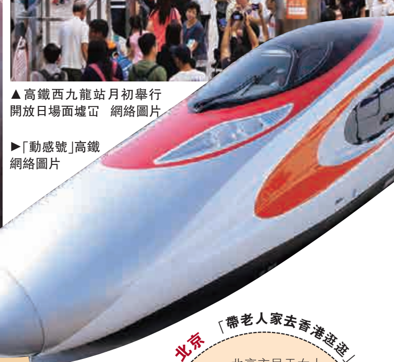
▶ 「動感號」高鐵路

北京 「帶老人家去香港逛逛」 北京市民于女士表示，自己平時就喜歡旅遊，總想着帶老人家孩子去香港，但是老人家礙於身體原因不喜歡坐飛機，廣深港高鐵路開通以後可如願帶老人家去香港逛逛。「雖然時間有點長，但是相信對老人們來說是一個比較妥當的選擇。」 (記者 馬靜)