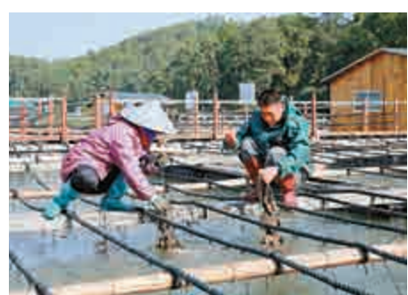
▲蠔農對可上市的生蠔能收盡量收

對可上市的生蠔能收盡量收。此外，陸上的淡水魚養殖戶除了提前打撈一部分外，選用抽水機抽掉了一部分水使水位降低，以防水漫魚塘。