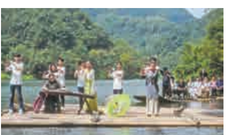
▲13日，浙江杭州市紫荊村舉辦特色「水上竹笛音樂會」。

洲10日遊3.5萬元高出43%，但因旅遊團全由建築師同行組成，且可前往歐洲多個不對外開放的樓盤參觀，價格貴一點都值得。