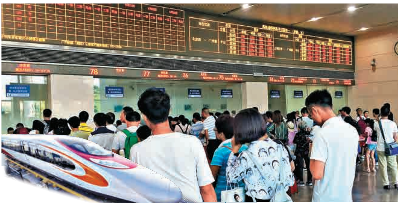
▲據鐵路部門介紹，在票源分配上始發列車所在站一般獲得全數車票。

返程上，廣州南前往香港的G6501次列車，除商務特等座顯示剩餘4張票外，一等座和二等座均充足。來自鐵路部門消息指，截至14日已售出9月23日廣州南站始發前往香港的車票近5000張，平均每日售出1000張左右，這表明內地居民赴港熱情依然高漲。 據鐵路部門介紹，票源分配上始發列車所在站一般獲得全數車票，始發／終到站之間票源最豐富，對兩端乘客購票最有利。這不難解釋，不論是廣州南至香港，還是深圳北、福田至香港，票源十分充足。細心的旅客會發現，廣州南站開通日首發列車6501次車，開售2天後一等座顯示僅剩個位數，如今卻顯示票源充足。對於是否有人退票，鐵路部門解釋，為防有人囤票，不會一次性放出全部車票。 廣深港高鐵票源充足，也和車次豐富大有關係。記者透過12306網站發現，廣深港