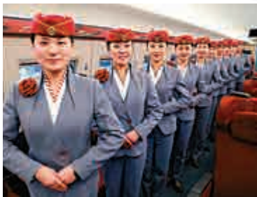
▲鄭州東站把微笑服務貫穿於服務的每一個環節。