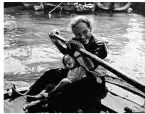
▲陳復禮作品《漁家樂》