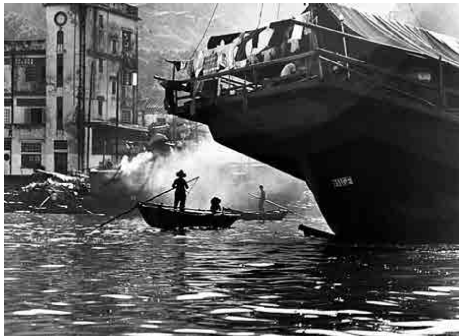
▲陳復禮鏡頭下的上世紀60年代的香港仔漁港