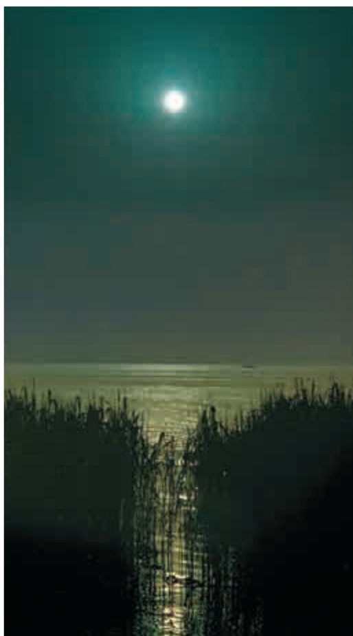
▲陳復禮作品《千里共嬋娟》