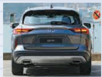
▲車尾線條討人喜愛