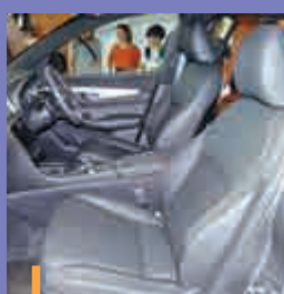
前排座椅有10種電動調校模式