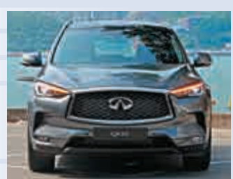
▲車頭造型充滿時代感