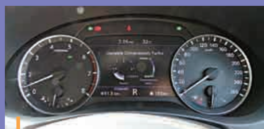
儀表採用傳統指針模式