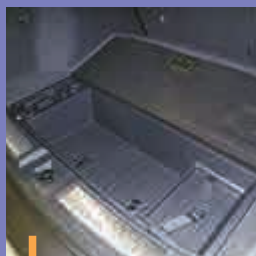
行李箱下面還有儲物格

如果大家對Infiniti產品感到陌生的話，筆者列舉以下兩個汽車品牌各位就一定不再陌生，它們分別是「雷諾 (Renault)」和「日產 (Nissan)」，前者是法國車壇先驅，後者則是日本車壇支柱，在2012年，前者斥資入股後者，並將合作的产品以全新名字推出市場，成就了Infiniti。