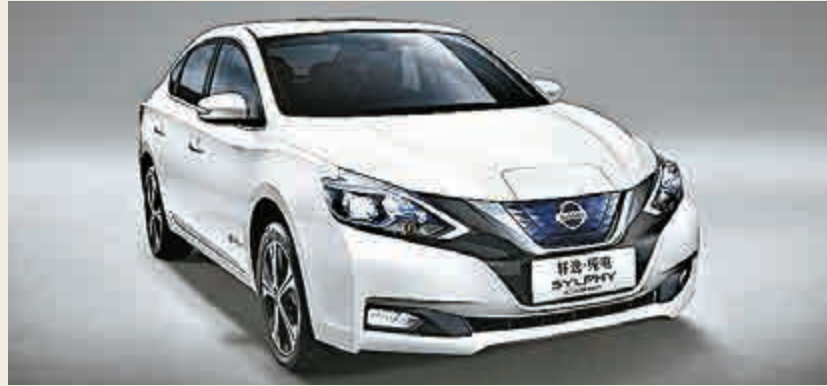
「軒逸」電動車 日產與東風汽車合作在華生產的

日產「軒逸」零排放還會在廣州花都的東風日產新車廠生產，預計年產10萬輛，將於2018年底開始銷售。