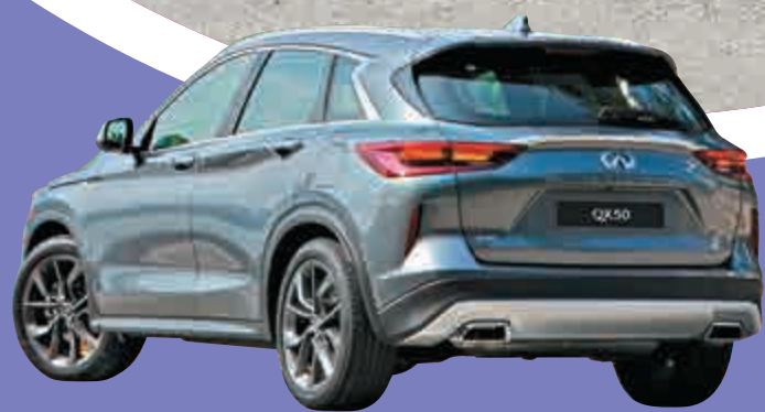
▲全新QX50對象是中產階層 ▲採用五門兩廂式設計