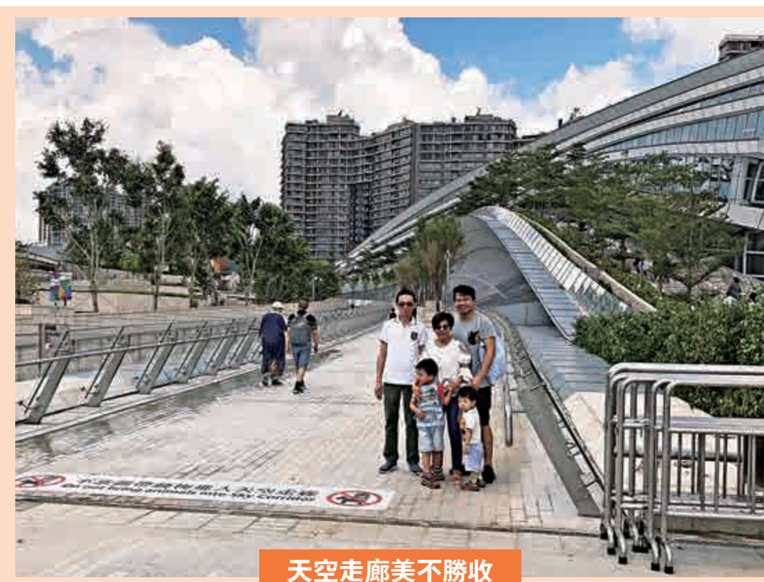
天空走廊美不勝收

西九龍站風景如畫，從綠化空間行上天空走廊，直達觀景台，沿途景色「遠近高低各不同」。綠化空間有不少遊人歇息，食雪糕、吃麵包，昨天烈日當空，綠化空間不時有微風撲面，感覺舒適。由綠化空間行上天空走廊需20分鐘，需爬多級樓梯，有遊客讚嘆猶如萬里長城，紛紛舉起手機「打卡」。登上觀景台，維港景色盡收眼底，遊人絡繹不絕，成為熱門「打卡」位。