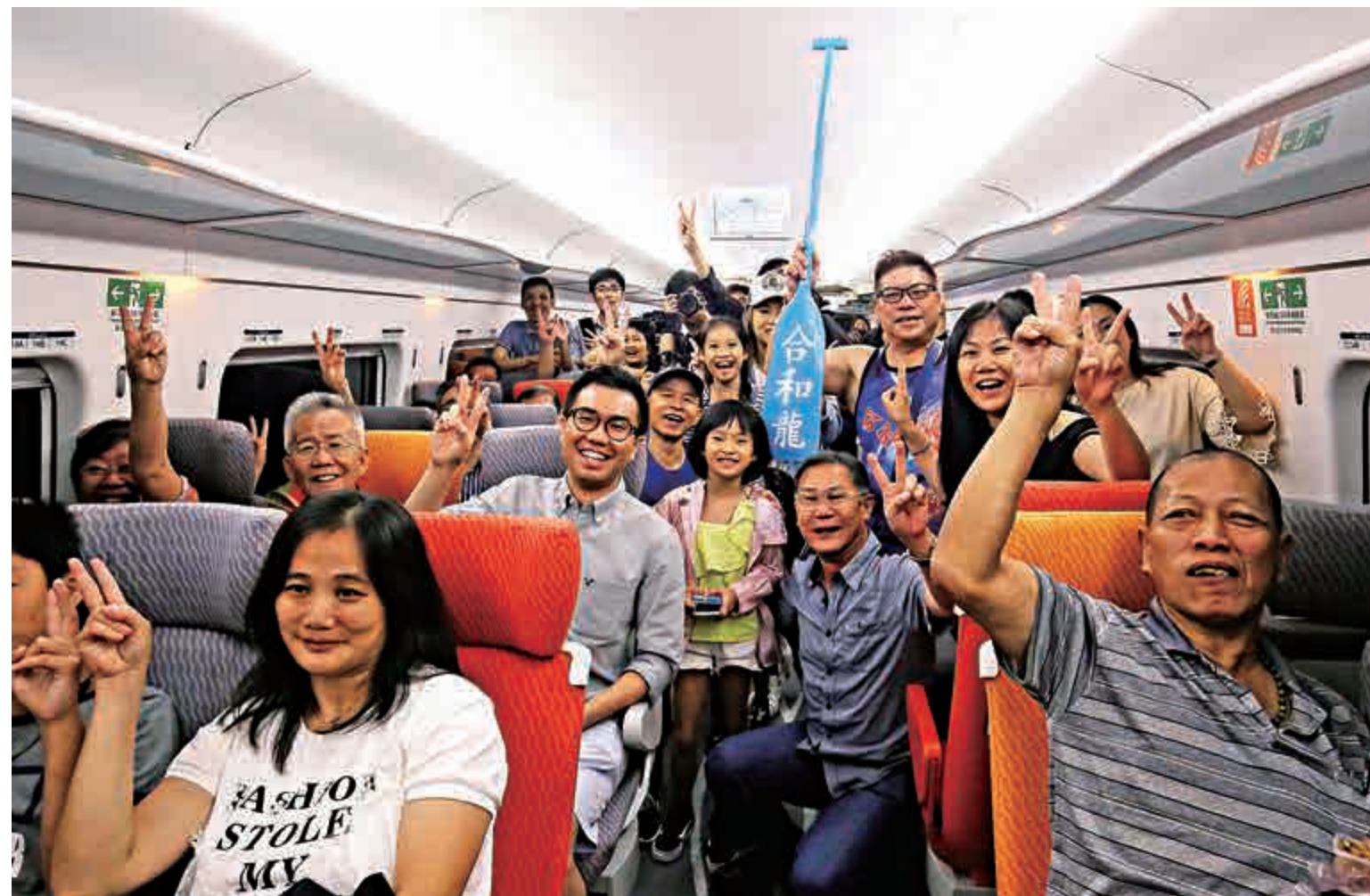
▲首班列車G5736今早七時開往深圳北，乘客們在車廂內興奮等待出發