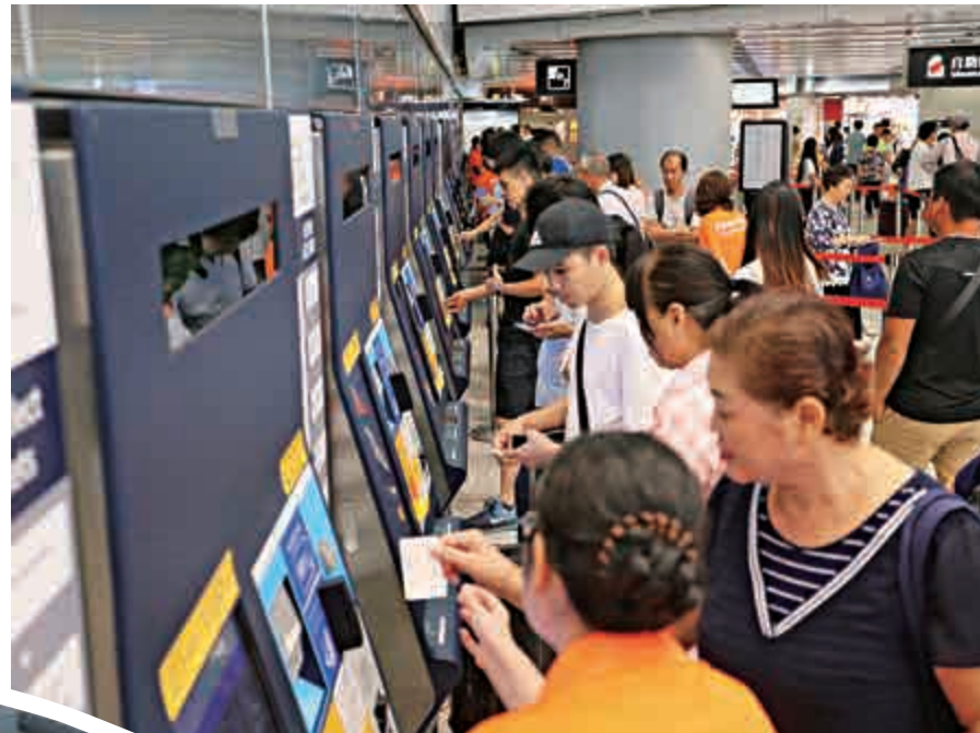
▲市民試用自助售票機購買車票，職員從旁協助，過程順利