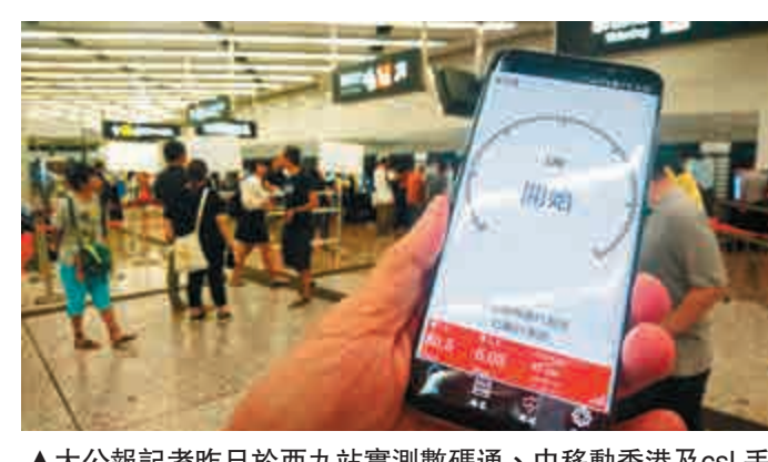
▲大公報記者昨日於西九龍站實測數碼通、中移動香港及cs1.手機4G流動數據速度