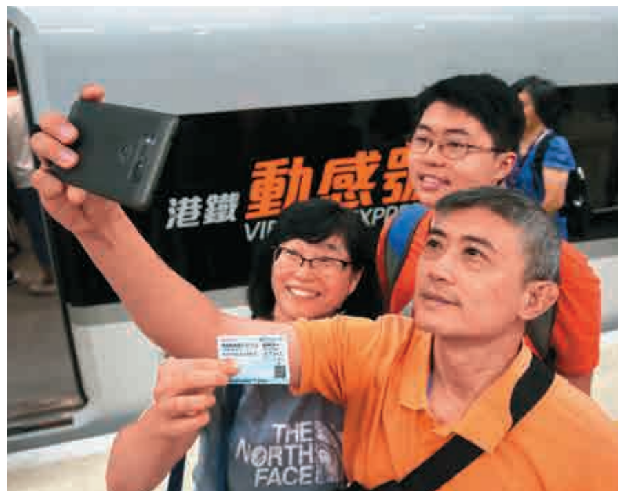
▲一家三口手執首發車票與動感號合照