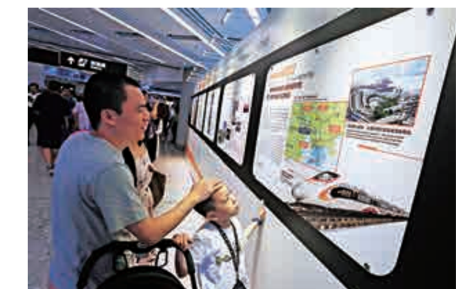
▲父親帶兒子到站內參觀「國家高速鐵路成就香港展」