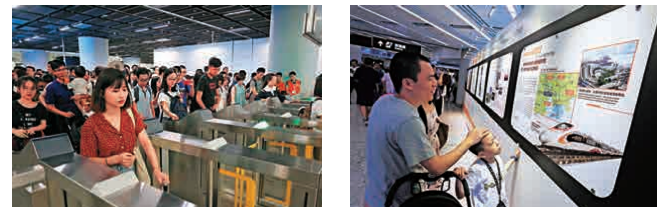
▲市民大讚過關過程順暢，較羅湖及皇崗關口時間快一半