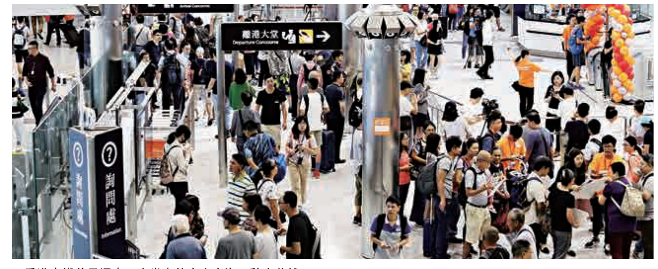
▲香港高鐵首日通車，大堂內外人山人海，秩序井然

西九龍站風景如畫，從綠化空間行上天空走廊，直達觀景台，沿途景色「遠近高低各不同」。綠化空間有不少遊人歇息，食雪糕、吃麵包，昨天烈日當空，綠化空間不時有微風撲面，感覺舒適。由綠化空間行上天空走廊需20分鐘，需爬多級樓梯，有遊客讚嘆猶如萬里長城，紛紛舉起手機「打卡」。登上觀景台，維港景色盡收眼底，遊人絡繹不絕，成為熱門「打卡」位。