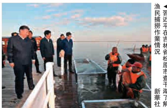
▲習近平在吉林省松原市查干湖了解漁民捕撈作業情況