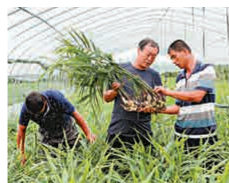
▲河北唐山的農戶在大棚內查看生薑生長情況

健全。探索形成一批各具特色的鄉村振興模式和經驗，鄉村振興取得階段性成果。到2035年，鄉村振興取得決定性進展，農業農村現代化基本實現。到2050年，鄉村全面振興，農業強、農村美、農民富全面實現。