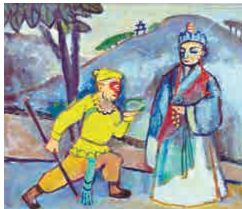
▲關良1978年油畫《唐僧與悟空》（Lot 1038，47.5 x 54cm）估價80萬至120萬港元，買家競相出價終以996萬港元成交

塑家以及畫家合作，並將他們的作品布置在建築的廳堂或庭院內部；亨利·摩爾（Henry Moore）和朱銘的雕塑都是「座上賓」，趙無極的繪畫無疑也成爲建築空間中的絕佳配合，而且趙無極在巴黎工作室的建築外立面和貝聿銘的建築風格也如出一轍。貝聿銘的建築事業不斷發展，多次邀請趙無極爲旗下項目創作壁畫。