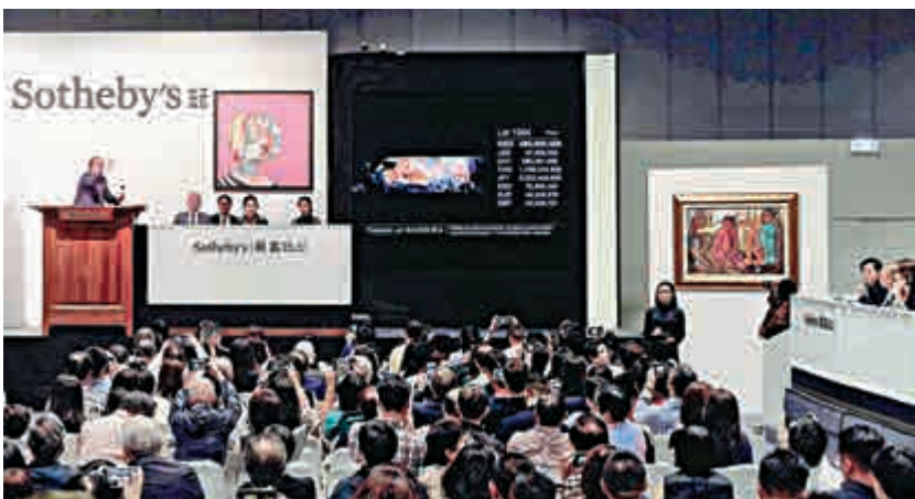
▲觀眾紛紛舉起手機記錄《1985年6月至10月》落槌成交一刻

《1985年6月至10月》的誕生契機源自知名華人建築師貝聿銘之邀請。趙無極與貝聿銘同樣出身民國時期大家族，父親俱為大銀行家。1952年，兩人於巴黎皮耶勒布畫廊一見如故，自此展開長達六十多年的友誼。貝聿銘很喜歡和雕