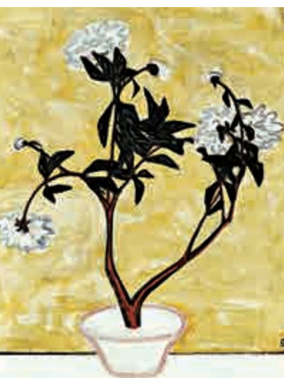
▲常玉1940至50年代油畫《盆中牡丹》以6893萬港元成交