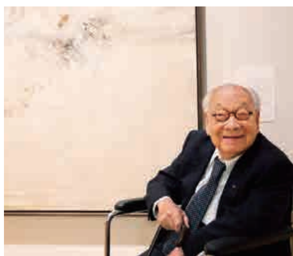
▲99歲的貝聿銘坐着輪椅到紐約亞洲協會美術館欣賞老友趙無極的作品，並與自己曾收藏的《15.04.77》合影