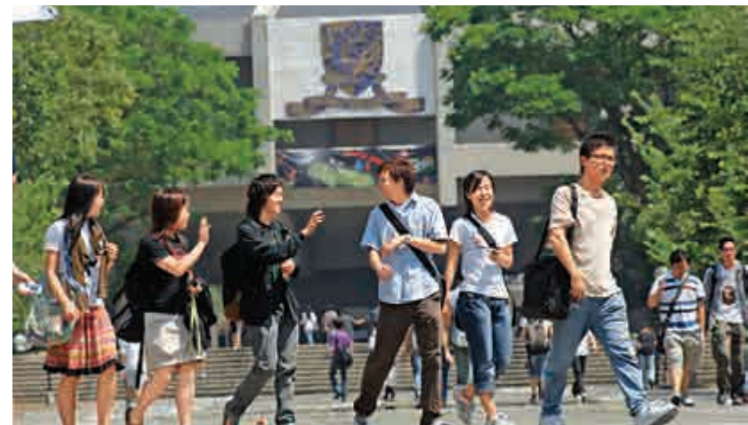
▲中大工程學院和理學院下學年調整入讀門檻

符合資格考生填報志願時，若把中大理學院或工程學院的課程排在前列位置，兩所學院將主動為該考生作特別考慮，包括給予面試機會。