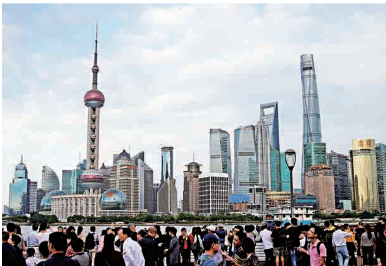
▲今年是改革開放40周年，中國佔世界經濟的比重僅次於美國