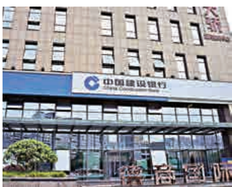
▲中資金融股昨日沽壓較大

個股表現方面，金融股是拖累大市的元兇，佔指數跌幅318點。內銀股方面，工行股價跌3.3%，報5.53元；建行股價跌3.2%，報6.62元。本地銀行股中銀香港（02388）股價跌2.8%，報36.15元。另外，滙豐控股（00005）跌2%，報67.75元。保險股偏弱，友邦保險（01299）股價跌3.3%，報67.55元；中國平安（02318）跌2.7%，報77.3元。