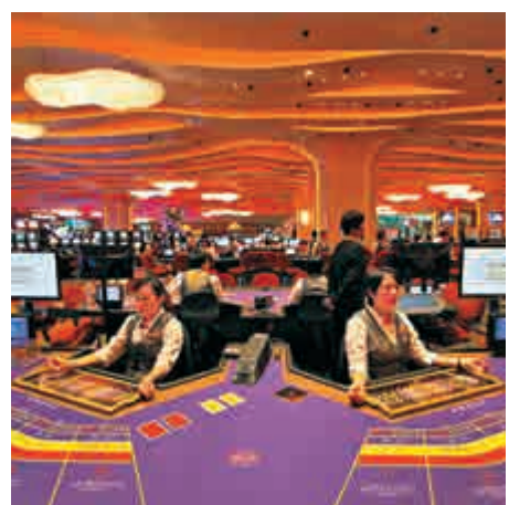
▲澳門上月賭收較預期差，賭業股受壓

預期第四季增長率有望改善至5%至10%，主要受穩定的中場增長支持濠賭股的盈利能力，但對明年預期趨於保守。該行建議選擇中場業務覆蓋較多，且第三季有盈利提升空間的股份，首選金沙中國。