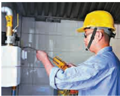
▲市場憂慮取消燃氣初裝費，燃氣股昨日跌幅顯著

年達98.5%，區內對天然氣資本開支和分銷商激勵因素的需求較低。相對地，全國平均天然氣滲透率目前僅四成。另外，該行亦指出市場認為連接費為高毛利項目屬誤解，因為相關費用除了建築成本，亦包括30年維修保養。若計及維修保養，連接費毛利屬合理水平。