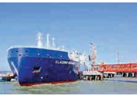
▲今年7月19日，亞馬爾首船15.9萬方液化天然氣運抵江蘇如東

【大公報訊】據新華社報道：俄羅斯諾瓦泰克公司董事長米赫爾松2日表示，位於北極圈內的中俄亞馬爾液化天然氣項目第三條生產線將於今年12月投產，比原計劃提前一年。