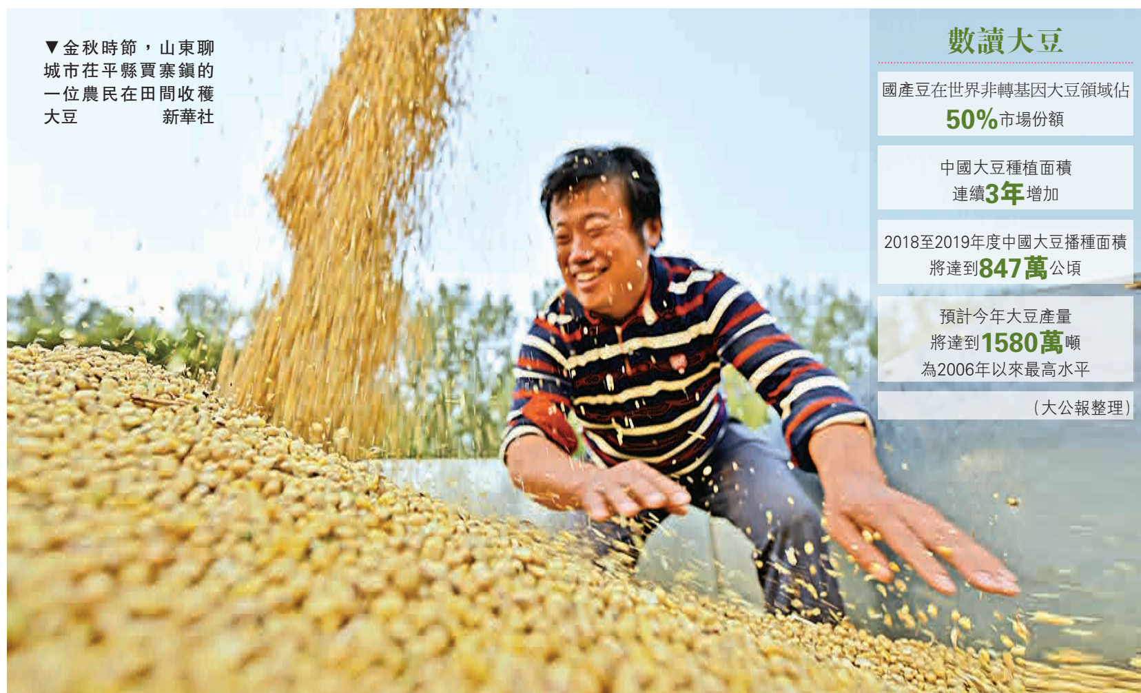
▼金秋時節，山東聊城市茌平縣賈寨鎮的一位農民在田間收穫大豆