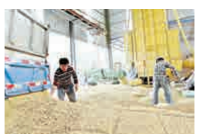
▲山東農民在賈寨鎮後寨村烘乾大豆

點主要以種糧大戶、家庭農場、合作社、農業企業等新型農業經營主體為載體，推廣玉米與大豆輪作，一年新增優質高蛋白大豆50萬畝。