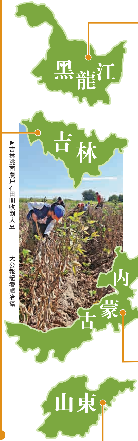
▶吉林洮南農戶在田間收割大豆