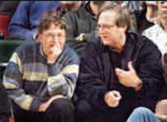
▲ 2003年艾倫(右)和蓋茨在觀看NBA籃球賽

艾倫與蓋茨在對員工態度及股權等問題上發生紛爭，1982年9月他被查出患有淋巴瘤，次年離開微軟，但一直留在微軟董事會直到2000年。