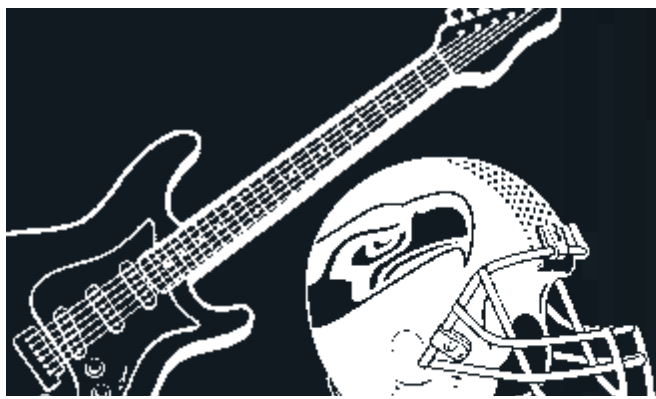
▶ 保羅艾倫