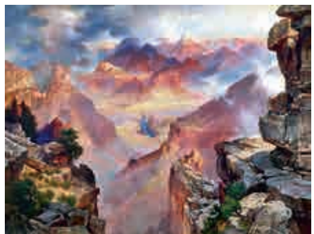
▲ 艾倫收藏的美國畫家托馬斯·莫蘭的《亞利桑那大峽谷日落》 網絡圖片