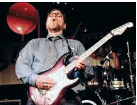
▲ 1997年，艾倫在西雅圖的一場派對上彈奏電結他

艾倫的朋友表示，他對慷慨和美好世界的追求令人感動。艾倫也許諾會將自己的大半財產捐給慈善事業，爲人類的福祉服務。