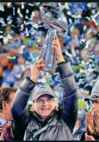
▲ 2014年艾倫在西雅圖海鷹隊獲勝後持獎盃慶祝

艾倫保有微軟28%的股份，成爲億萬富翁，他開始投資體育、藝術、科研和慈善。《福布斯》本月估計，艾倫的財富多達217億美元，全球富豪排名第44。