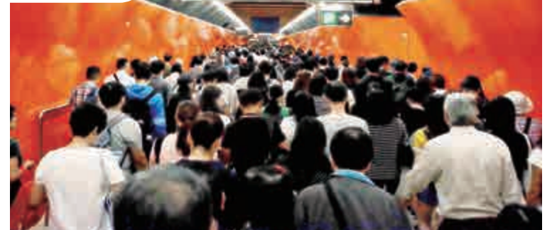
▲港鐵信號故障大混亂，將軍澳線北角轉車月台迫滿人