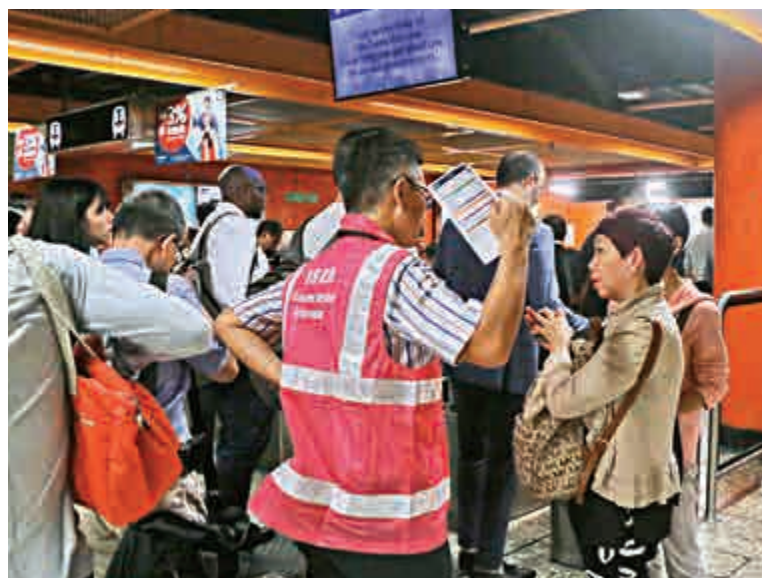
▲北角站內職員向市民解釋延誤安排