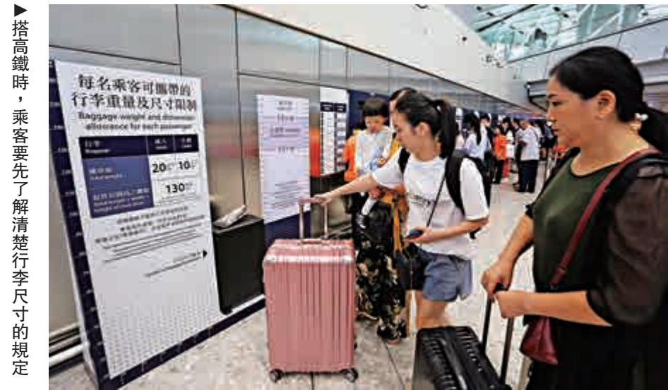
▲搭高鐵時，乘客要先了解清楚行李尺寸的規定

據鐵路部門介紹，當乘客發生跨境誤乘的時候，應在十分鐘內向列車或車站人員作聲明；前方車站在車票背面會註明「誤乘」並加蓋站名戳，再指定最近列車免費送回。