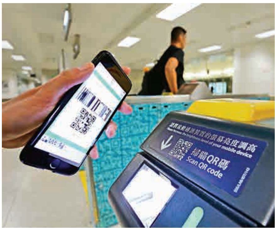
▲現時機鐵站可使用微信支付入閘