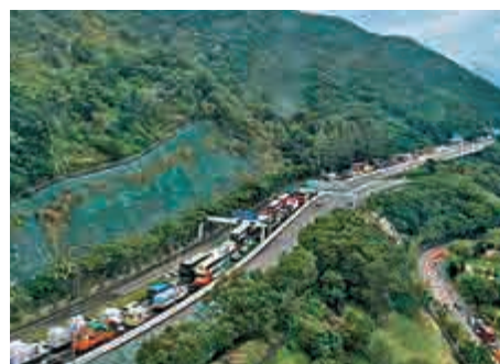
▲青嶼幹線去年八月出現大混亂，申訴專員公署收到兩宗投訴後展開調查，揪出「元兇」

升職員能力，加強職員在同類臨時交通安排策略上的培訓，提升啟動及調整應變措施的能力和敏感度。