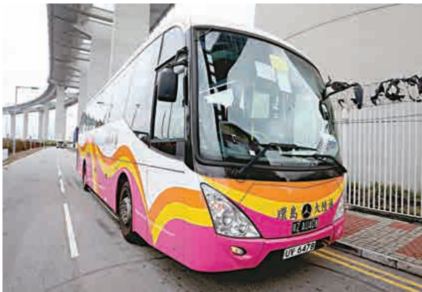
▲由冠忠巴士牽頭的聯營的「港澳快線」，提供逾400班巴士，每日24小時往返三地

黃良柏又稱，已接獲不少查詢，相信不少珠西地區將來取道大橋訪港，故對大橋客量展望感到樂觀。