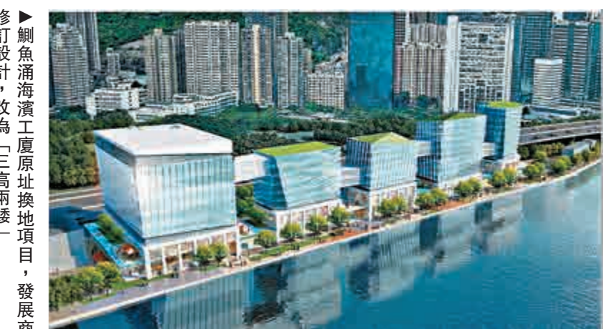
▶修訂設計，改為「三高兩矮」