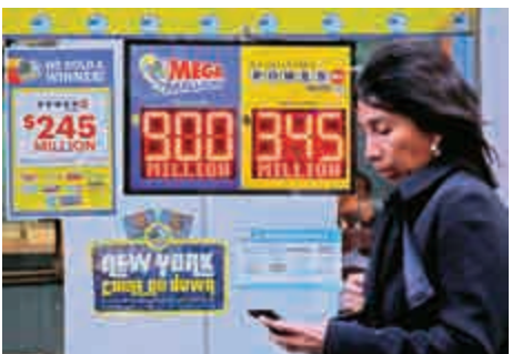
▲美國「百萬大博彩」獎金17日9億美元

【大公報訊】據美聯社、美國廣播公司報道：美國超級大獎「百萬大博彩」已經三個月沒有開出頭獎，其獎金近日再創新高，飆升至近9.7億美元（約76億港元），吸引大批民眾在20日開獎前爭