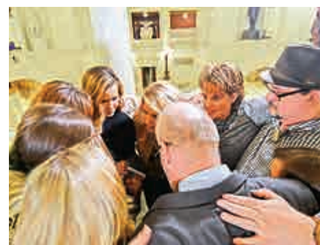
▲多名性侵害受害者17日在賓夕法尼亞議會大廈相擁

起SNAP曾三次要求聯邦政府對全國範圍內的1500名在職或退休的神職人員展開調查。