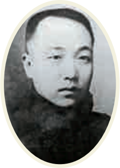
陝西辛亥革命領袖井勿幕

勿幕門民間又稱小南門，位於西安南城牆含光門與朱雀門之間，是民國時期開闢的城門。勿幕門為單門洞，門內為四府街。上年紀的西安人大多能說出，勿幕門是國民政府紀念革命英烈井勿幕而命名。這位被孫中山先生譽為「西北革命巨柱」的翩翩少年，年僅三十歲便以身殉國。「四府街」也曾在民國期間更名為「井上將街」，門街共通，以垂永久。