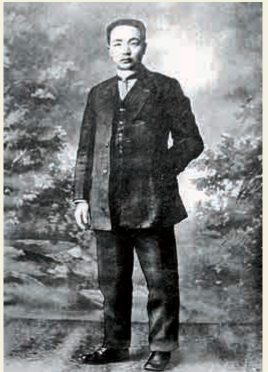
被孫中山譽為「西北革命巨柱」的井勿幕