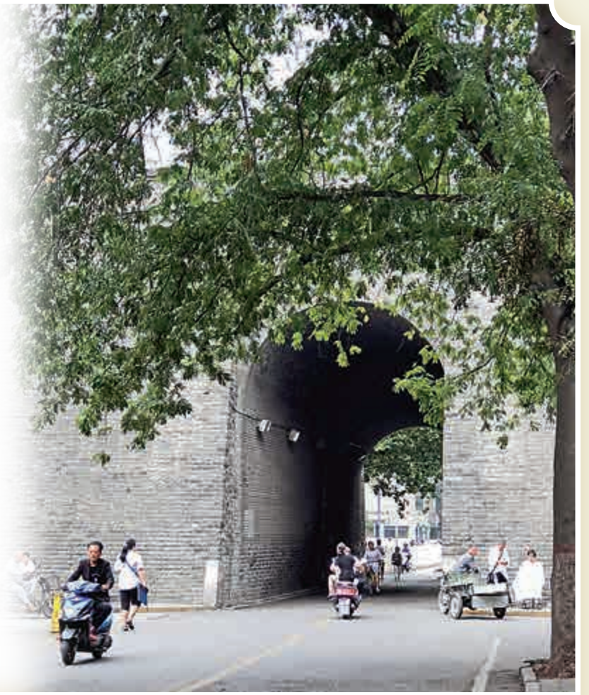
位於西安南城牆的勿幕門