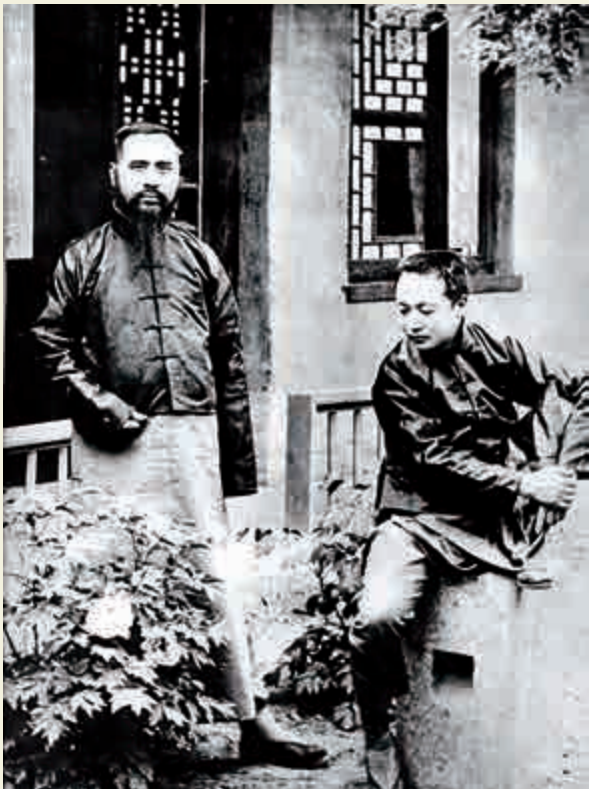
井勿幕（右）與于右任