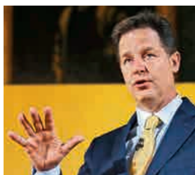
◀英國前副首相克萊格進Fb領導環球政策和交流團隊

政客卻是頭一回。克萊格19日表示，身處英國政壇20年後，Fb的工作將是「一場令人興奮的新冒險」。