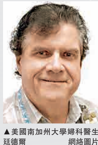
▲美國南加州大學婦科醫生廷德爾

南加大於19日表示，任何在1988年至2016年接受過廷德爾婦科檢查的女性，都可獲得2500美元（約兩萬港元）賠償，提交書面聲明、寫下受害細節以及心中陰影的女性，則可以獲得7500美元至兩萬美元（5.58萬至15.6萬港元）賠償，那些願意與心理醫生見面、經證實因廷德爾騷擾而遭受創傷者，最高可獲25萬美元（約195萬港元）賠償。