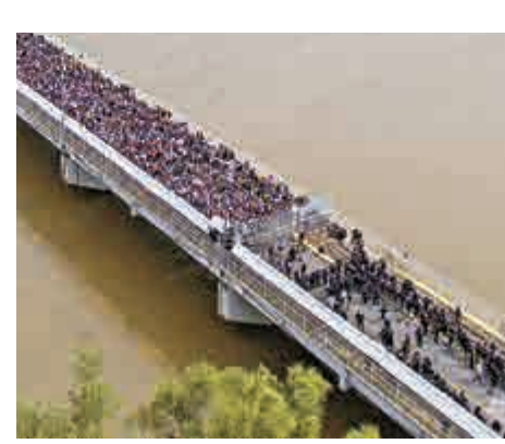
▲上千洪都拉斯移民與墨西哥警方19日在蘇恰特河跨國大橋上對峙

助處理移民尋求難民身份的案件。此外，洪都拉斯總統埃爾南德斯今天表示，他已徵求危地馬拉政府同意，派遣民事保護人員幫助在危地馬拉的洪都拉斯人，並為那些想返國的人尋找交通工具。