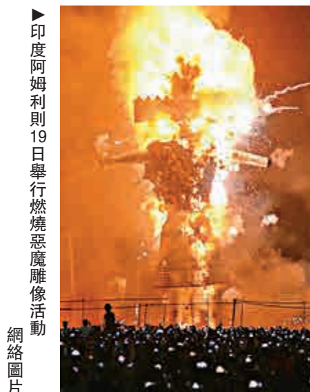
▶印度阿姆利則19日舉行燃燒惡魔雕像活動 網絡圖片