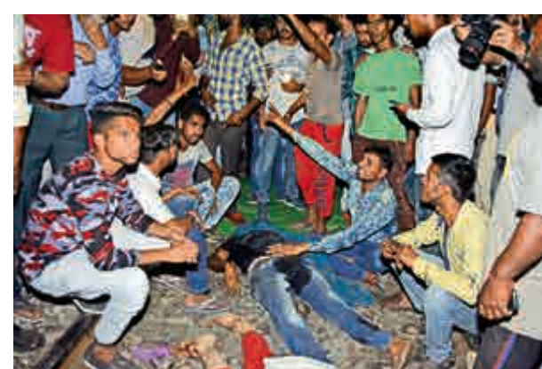
◀幸存者聚集在遇害者屍體旁邊，指責活動策劃方未與鐵路部門事前溝通

旁遮普邦工人福利董事會的前任主席亞達夫稱，許多遇難者都是來自其他邦的民工，他們背井離鄉到旁遮普邦的工廠或商舖工作，有些人月薪只有7000盧比（約747港元）。當地政府宣布給每位遇難者50萬盧比（約5.3萬港元）的補償金。印度總理莫迪也對這起事故表示哀悼，並宣布給每位遇難者增加20萬盧比的補償金。