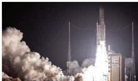
◀日歐聯合水星探測器19日在南美洲法屬圭亞那的庫魯太空中心成功發射

柱形，配有可伸長至15米的天線。它將在繞水星飛行起開始觀測磁層及稀薄的大氣等水星周邊環境。MPO則搭載了激光高度計與攝像頭等設備，將調查水星表面地形與地表所含礦物等水星表面。觀測時間各為1年左右。此次計劃由ESA主導，探測器搭載的火箭為法國阿麗亞娜航空公司的「阿里安5」。