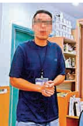
▲兩小時充電准許證