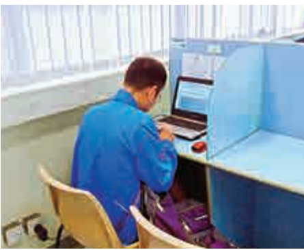
▶在鰂魚涌自修室有家用使用插座為手提電腦充電