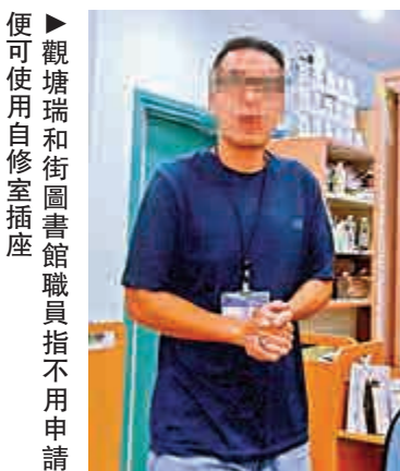
▶觀塘瑞和街圖書館職員指不用申請便可使用自修室插座