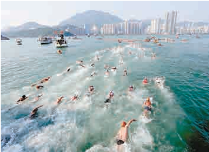
▲今屆維港渡海泳料有3000人參加，圖為去年的盛況

【大公報訊】一年一度的維港渡海泳今日舉行，預料有3000人參賽，今年是第二年復辦40年前的經典路線，泳手可游越維港中央，由尖沙咀公眾碼頭至灣仔金紫荊廣場，賽道全長約1000米。環境局局長黃錦星昨發表網誌表示，復辦的成功關鍵是1994年開始動工的「淨化海港計劃」，令水質得以提升。 黃錦星提到，政府在施政報告中提到進一步改善維港沿岸水質及整體環境的顧問研究，已大致完成，部門會根據研究建議，逐步推行更多針對性的污染控制措施及工程方案。 此外，運輸署指出，在今日早上7時半至10時半，來往尖沙咀與灣仔的渡輪服務將暫停；而在博覽道東金紫荊廣場外的路段，包括上落客區，將在今日凌晨約1時30分至下午2時臨時封閉。 淨港計劃改善維港水質 黃錦星還說，啟動至今逾四分一世紀的「淨化海港計劃」，涉及有兩項之「最」的昂船洲污水處理廠，一是世界「最大」化學強化一級污水處理廠，二是世界上「最深」的排污隧道，埋於163米以下海底，相當於反轉整幢中環怡和大廈的深度。 淨港計劃分兩期進行，合共服務約570萬人口。第一期在2001年投入運作，每日處理約75%來自荃灣、葵青、將軍澳、九龍市區和港島東北部產生的污水，經深層隧道輸往昂船洲污水處理廠，集中處理及消毒後才排放；第二期在2015年全面啓用，處理北角至鴨脷洲一帶的污水，經由另一組隧道輸往昂船洲處理廠。 污水沉澱後會變成「污泥」，渠務署每日產生逾千公噸脫水污泥，會送到2016年5月正式啓用的T·PARK轉廢為能。黃錦星補充，九龍西及荃灣的旱季截流器已開始施工，以提升維港沿岸水質和改善近岸氣味問題，亦正籌劃其他維港沿岸地區的同類設施。