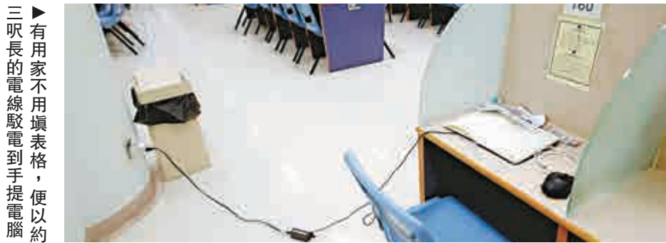
▶有家用不用填表格，便以約三呎長的電線駁電到手提電腦

粉嶺厲行 大埔觀塘任「叉」 惟每間自修室對充電規則的把關程度竟然是「各處鄉村各處例」。記者隨機抽查港九新界共四間自修室，發現執行規則的鬆緊程度相差甚遠，可說是「自由發揮」。以最嚴格的粉嶺自修室為例，那裏當眼處及每格座位都貼出相關規則。職員巡視發現用家沒有申請，便會要求他們填寫申請表格。 而一區之隔的大埔自修室，卻呈現極大落差，在該自修室的當眼處既沒有貼出相關規則，亦沒有職員巡查，用家毋須申