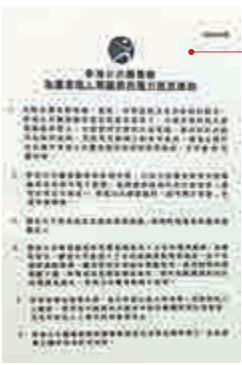
▶粉嶺自修室多處貼出使用充電插座的通告