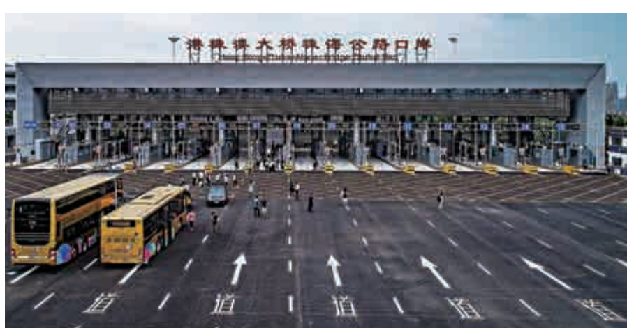
▲海洋公園將開通直通跨境巴士線，讓內地遊客經港珠澳大橋直達公園。