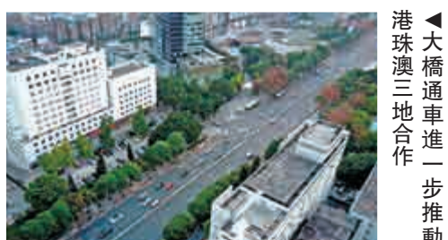
▲大橋通車進一步推動港珠澳三地合作。