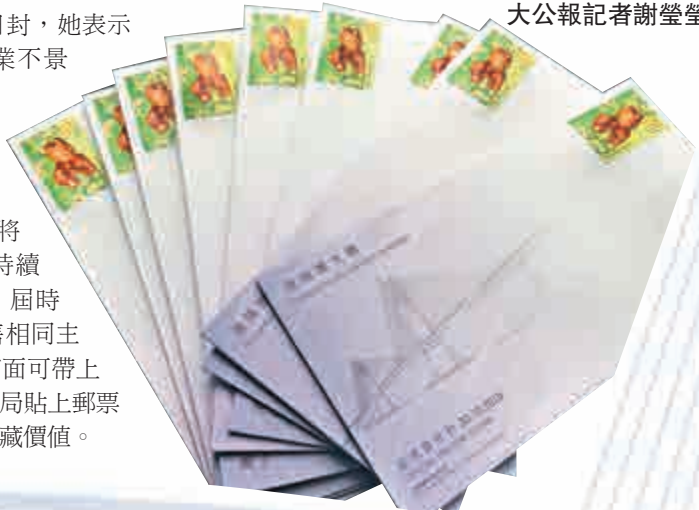
▼大橋於「狗年」開通，王女士特意在信封上貼上「狗仔」圖案的郵票。

以「港珠澳大橋」為題首日封將在香港各大郵局持續發售至本月30日，屆時，香港郵政將發售相同主題的特別郵票，市面可帶上已購買的信封到郵局貼上郵票及蓋章，實現其收藏價值。