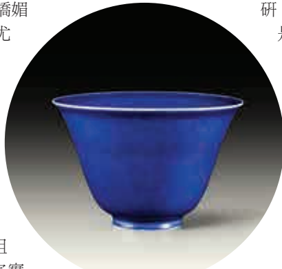
▲竹月堂藏明嘉靖霽藍釉鐘式盃