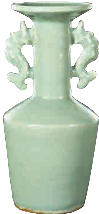
▶竹月堂藏宋代或元代青色釉瓷雙魚耳紙槌瓶，浙江省龍泉窯（高24公分，寬11公分）