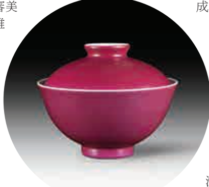
▲竹月堂藏清乾隆胭脂紅釉蓋碗