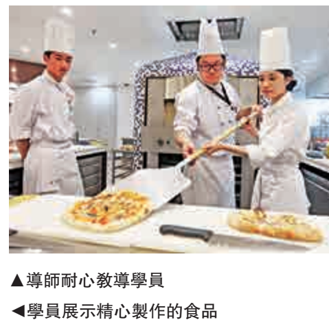
行政長官林鄭月娥主持國際廚藝學院開幕禮，對學員的手藝讚不絕口。