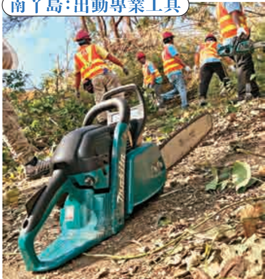
南丫島:出動專業工具