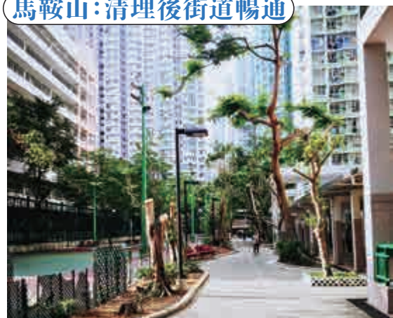
馬鞍山:清理後街道暢通