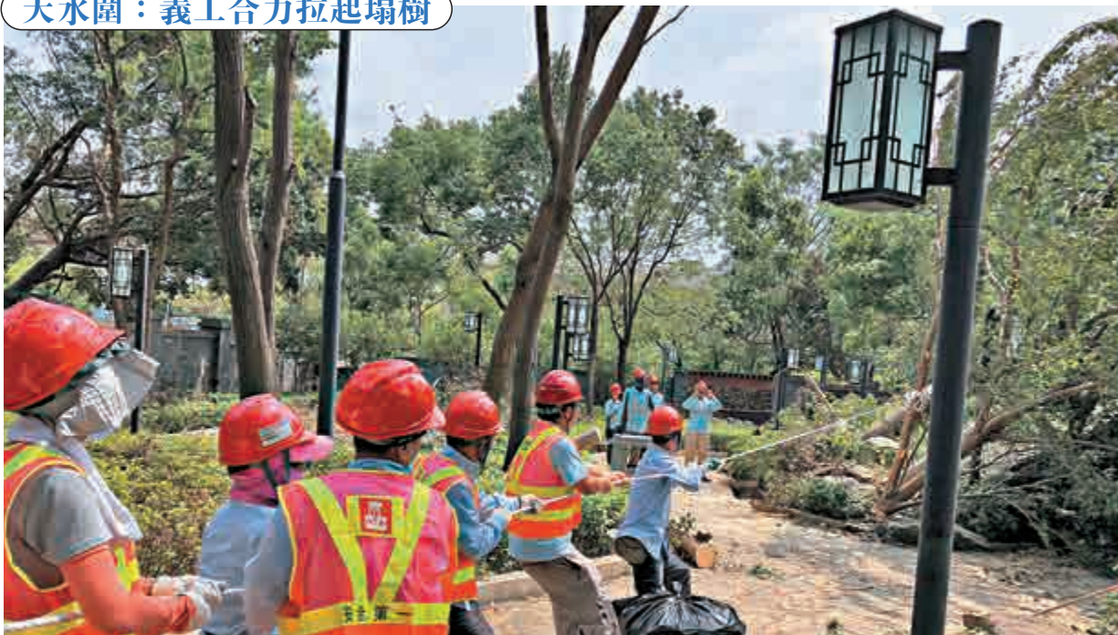
天水圍:義工合力拉起塌樹