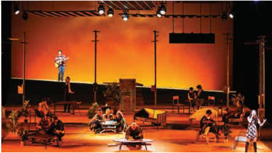
▼三個年輕人的生命在書信往來間成長