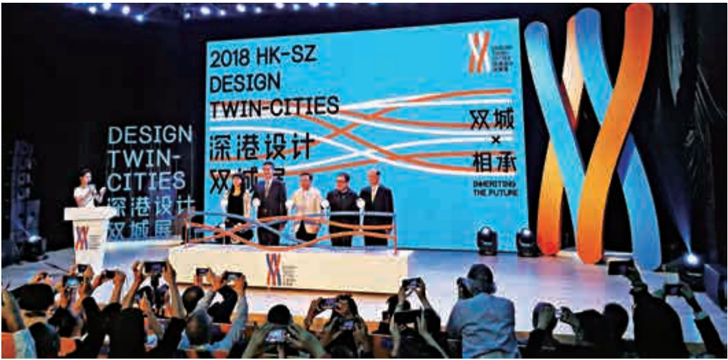
◀ 深港設計雙城展開幕

目前品牌共有三百多件產品，現場展出的產品別具一格，如一款摺紙藍牙音箱，用戶可以親手製