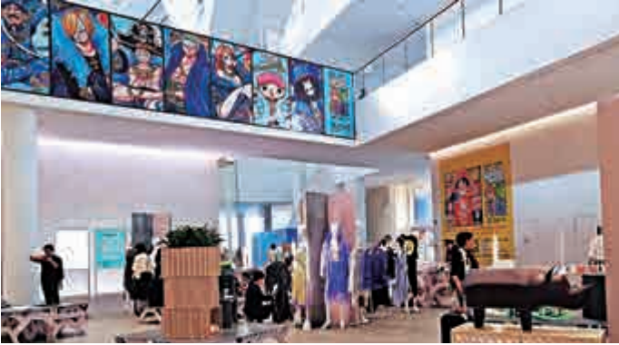
◀ 雙城展展示兩地合作創作作品